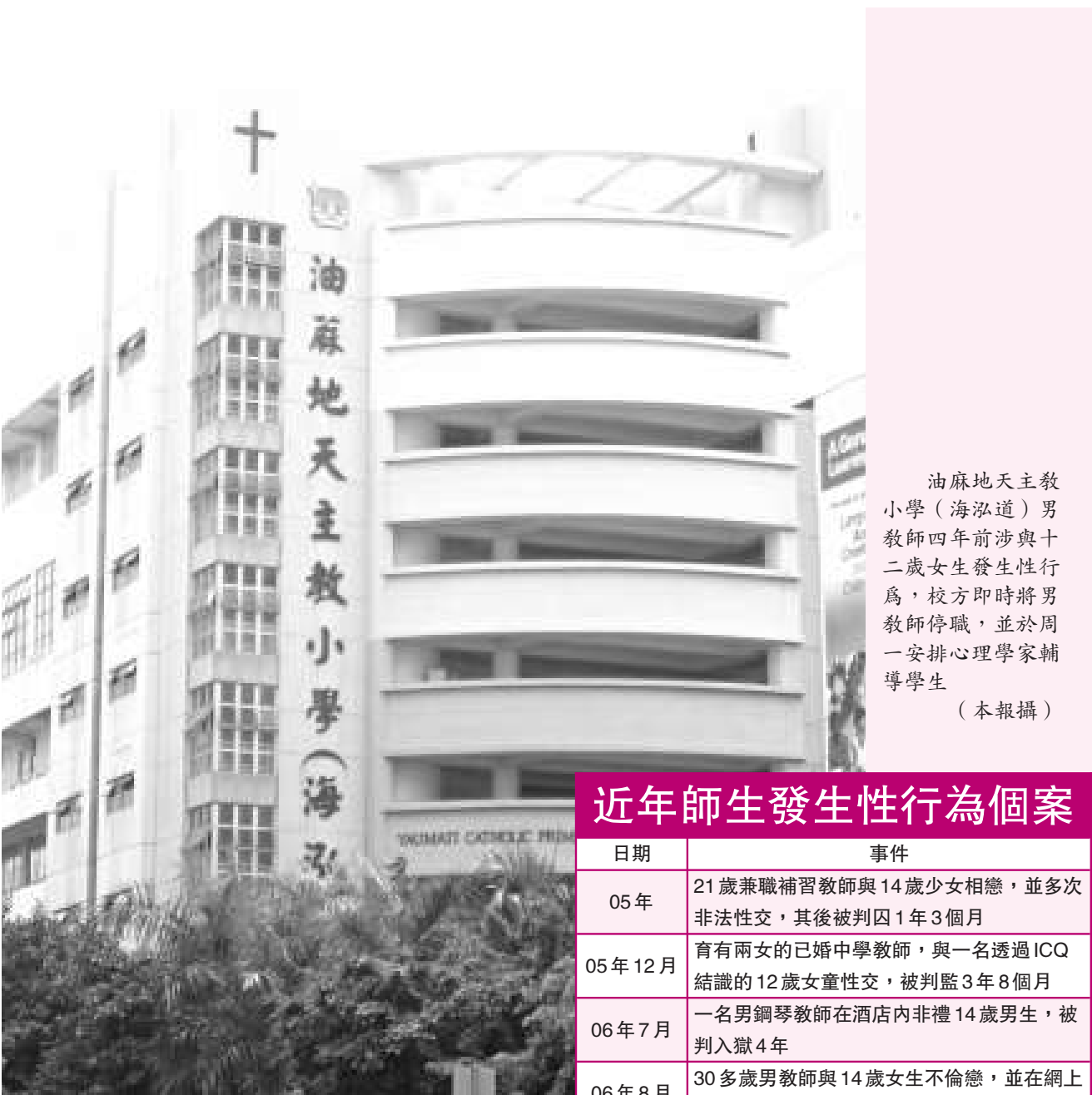
油麻地天主教小學（海泓道）男教師四年前涉與十二歲女生發生性行爲，校方即時將男教師停職，並於周一安排心理學家輔導學生（本報攝）

大賽由已備演講、即席演講及問答等部分組成，每年自五至六月至次年四月分為全國預選賽、地區決賽、全國總決賽等階段，面向全國包括港、澳、台地區所有高校舉行，每年均能吸引全國八百餘所高校近一百萬學生的參與和觀摩。從一九九六年創辦的全國英語演講比賽，以推動中國英語教育事業發展、促進學生英語交流能力提高為宗旨。繼在北京、上海、廣州、南京、成都、武漢等國內重點城市成功舉辦後，二〇〇六及〇七大賽總決賽移師澳門和香港，並邀請港、澳、台地區及韓國、泰國等亞洲其他國家的選手與中國學子同台競技，使比賽的水平和國際影響力得到了有效提升。