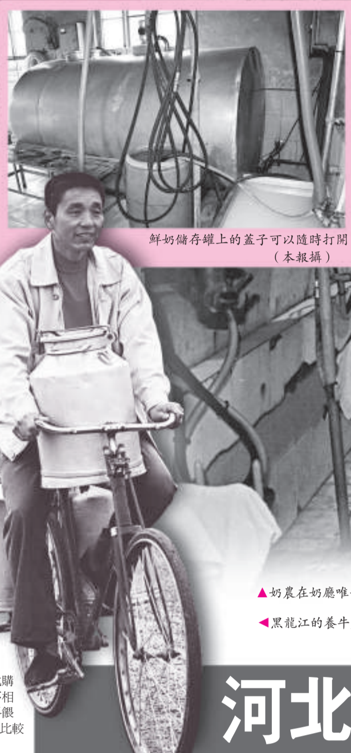
鮮奶儲存罐上的蓋子可以隨時打開