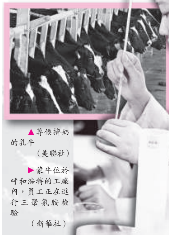
▲等候擠奶的乳牛

記者幾經周折拿到的「通知單」上分別列出了「感官檢驗、摻假檢驗、75%酒精試驗、入廠溫度、理化指標、微生物指標、發酵酸度」七項檢驗標準。奶廳老闆解釋說：「感官檢驗就是眼睛看、鼻子聞，這一項最重要，行不行感官說了算。」在兩地調查中，奶廳老闆都反映：「三鹿實檢一眼看高一眼看低，沒有科學的定制，譬如同樣的一車奶，在這個場化驗不合格，到另一個場就是一等奶。」有時候化驗員還主動提示奶廳老闆：「你們到其他地方看一看。」