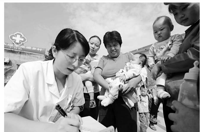
石家莊20輛醫療大篷車下鄉篩查結石患兒