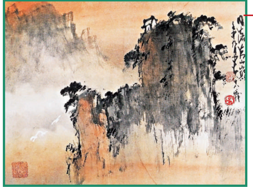
山水斗方(九十年代)