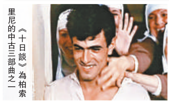
里尼的 《十日談》為柏索