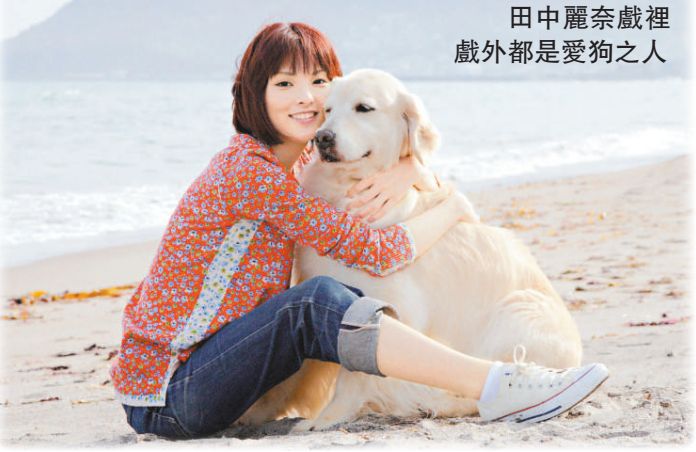
田中麗奈戲裡戲外都是愛狗之人