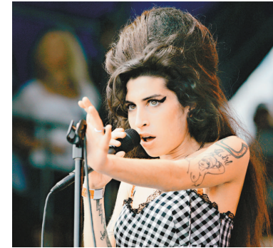
▲Winehouse錄碟進度緩慢 ▲唐尼（左）與賓史迪拿出席影展

據稱，Winehouse在那段期間，只灌錄了兩首尚未完成的歌。其好友又指，她的濫藥問題，可能令她的狀態再也無法完成其第三張唱片；該張新碟原本預計在今年內推出。