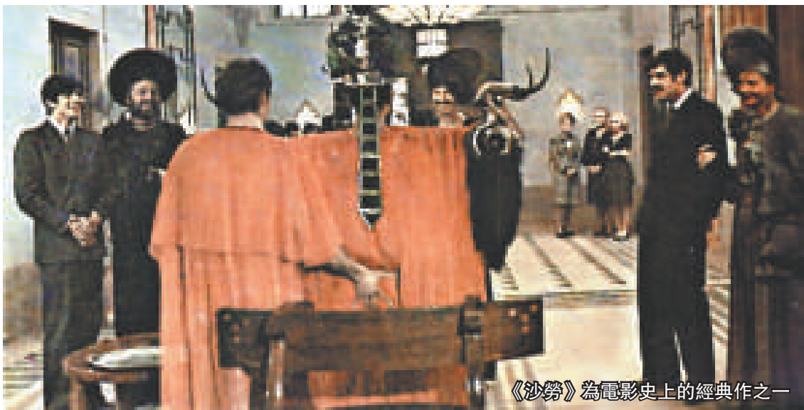
《沙勞》為電影史上的經典作之一