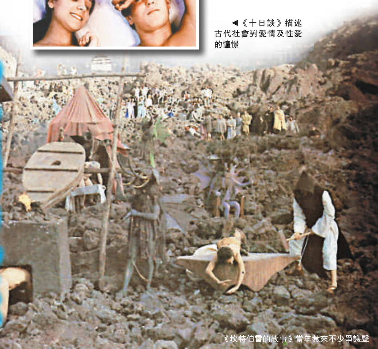
《坎特伯雷的故事》當年惹來不少爭議聲