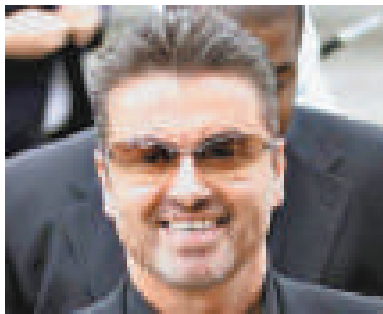
▲佐治米高又與毒品扯上關係，令人嘆息

據稱，Winehouse在那段期間，只灌錄了兩首尚未完成的歌。其好友又指，她的濫藥問題，可能令她的狀態再也無法完成其第三張唱片；該張新碟原本預計在今年內推出。