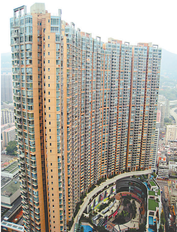
香港地少人多，大廈林立，無論是住宅還是商廈，都越建越高