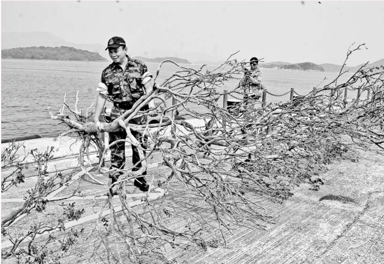
▲水警檢獲一批九里香 ▼涉案的走私快艇

資料顯示，去年共破獲二十八宗偷運樹木案件，共拘捕一百零六名涉案的非法入境者。由於警方水陸兩路大力打擊非法砍伐樹木，自年初至今，連同本案在內，劇降至兩宗，五人被捕。