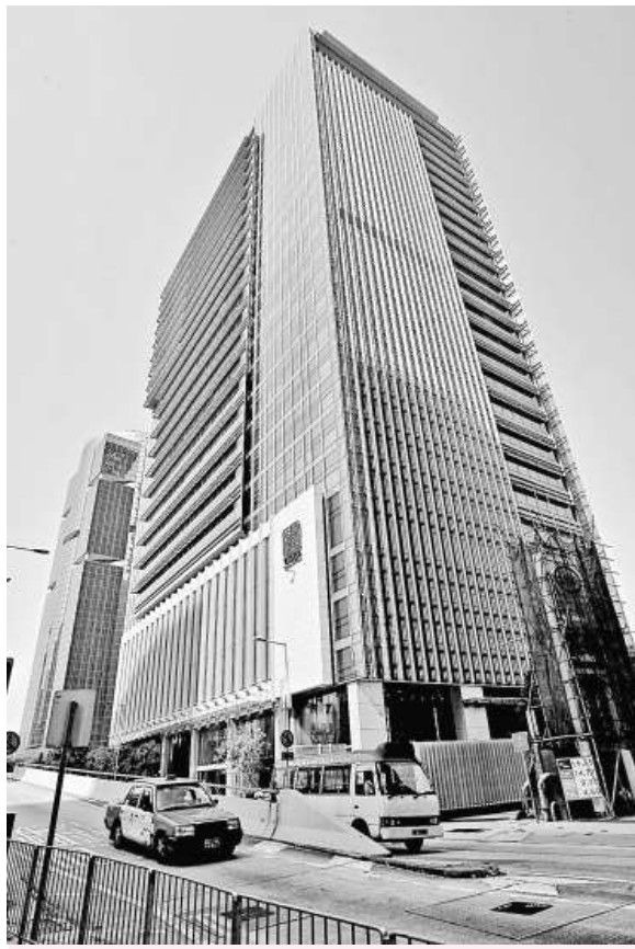
▲廉署接獲貪污舉報拘捕五人 ►警員的制服及頭盔疑被警員偷取出售 (資料圖片)