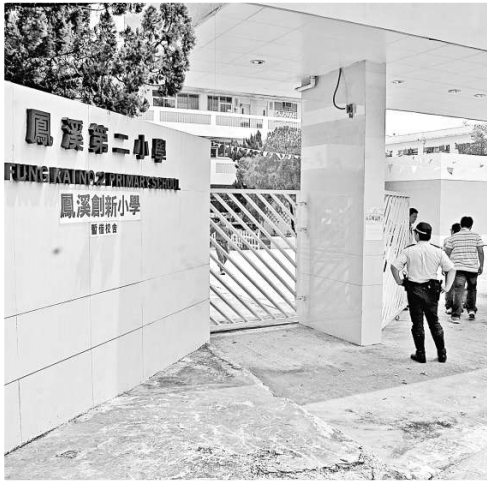
▲警方到學校調查 ►其中一名不適的女童

海關在三日前於大嶼山白芒破獲的走私案，檢獲主要來自印尼的五十三箱共重一千公斤的活水蛇，及三十五箱生猛澳洲龍蝦，全屬高檔貨，共重六百五十公斤。