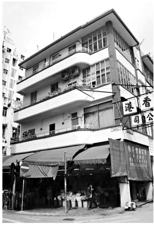
太子道西與園藝街交界的「摩登」唐樓

加費，除了飲食附加費，如咖啡、汽水等要付費外，現在更細分了有熱食附加費，即是三文治及餅乾不用付錢，但要熱食飛機餐的話便需付錢，因為空姐現在已是一盤飛機餐拿手拈來，另外毛毯、枕頭附加費現在已收很多航空公司的指定動作，毛毯及枕頭附加費現在已收兩美元。還有飛行里數附加費，將來你換熱線電話查詢免費，但你要對方辦手續、辦免費機票、辦理飛行里數便逐次算賬。這「招」在市場上便叫「分層收費」(Stratification)，將客戶各式各樣的需要逐項收費，簡單而言就是用戶自付。