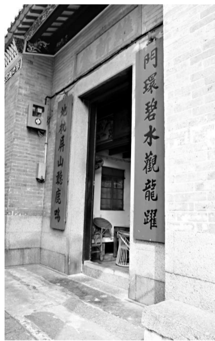
位於元朗屏山文物徑的若虛書室

在元朗屏山文物徑，沿途有很多古蹟點，其中供鄧氏族族人讀書的地方也有好幾間。位於坑尾村的維新堂，又稱「若虛書室」，是村中的數間舊書室之一。「若虛書室」由鄧氏十八世祖鄧若虛所建，在上世紀六十年代曾進行過修葺的工作。若虛書室現已被列為三級古蹟，並開放給市民參觀。