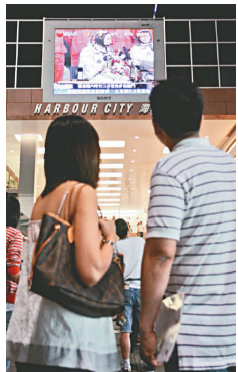
市民關注商場屏幕所播放的航天员消息

除了太空館，時代廣場、海港城和旺角等鬧市大電視屏幕下亦擠滿市民和遊客，大家都屏息靜氣定睛觀望，直至三個太空人成功出艙，市民紛紛拍手歡呼，掌聲響遍香江。