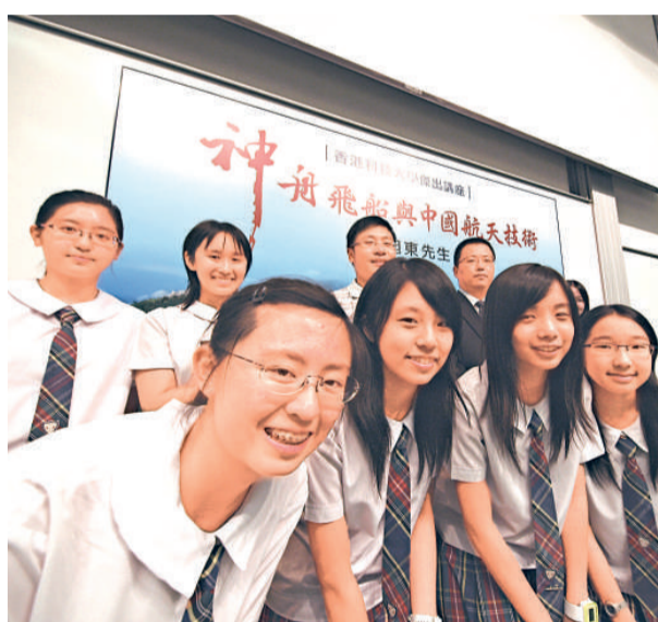
不少學生在講座後主動找講者合照

「神舟飛船與中國航天技術」邀得曾參與「神一」至「神五」著陸系統研究人員、現任亞太衛星公司執行董事