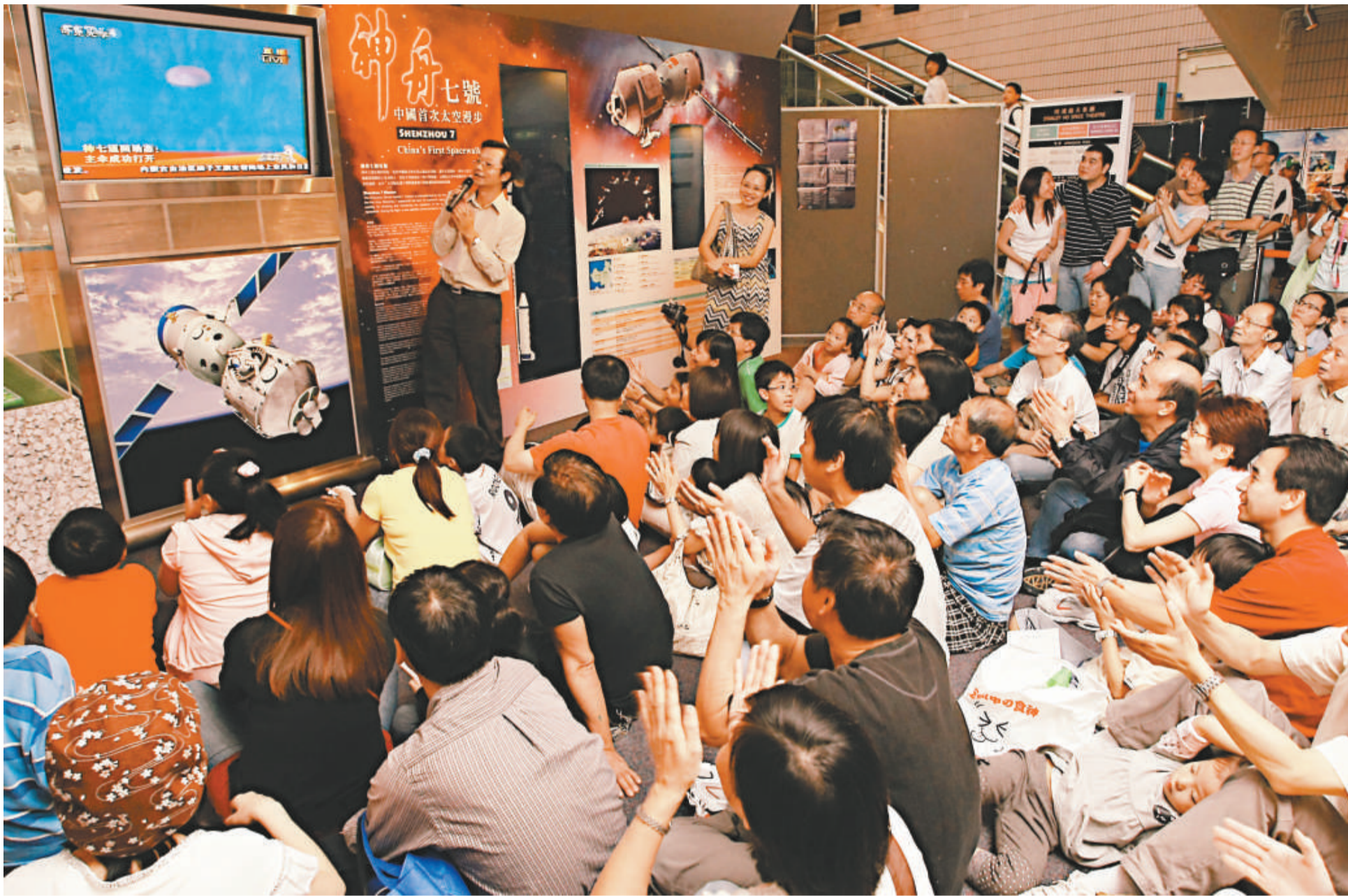
當看到航天员成功返回地球後，在太空館觀看直播的市民紛紛鼓掌賀