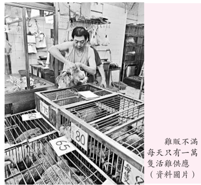
雞販不滿 每天只有一萬隻活雞供應 (資料圖片)