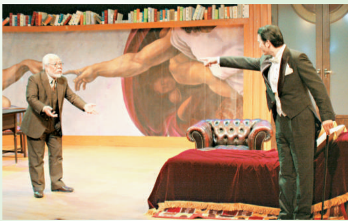
《奇異訪客》裡佛洛伊德面對神秘訪客手足無措

《奇異訪客》將於十月九日晚上八時，十月十一及十二日下午三時上演，《粉紅天使》則於十月十日及十二日晚上八時公演，地點是香港文化中心劇場，門票於城市電腦售票處發售，詳情可瀏覽www.theatrespace.org。