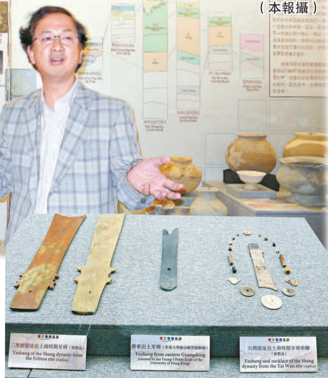
大灣出土的商代牙璋及牙璋串飾，有助研究商文化在東亞的分布

鄧聰自一九八五年在日本東京大學學成後，便回港從事考古工作，並成立了「懷土會」，培訓對考古有興趣的人士參與考古活動，以及擔任展覽導賞員。他說：「其實歷史就在我們的身邊。單在中大已有不少遺址，在吐露港的中間有六、七千年前的遺址，我相信崇基學院本來有更多遺址，只是被破壞了而已。」