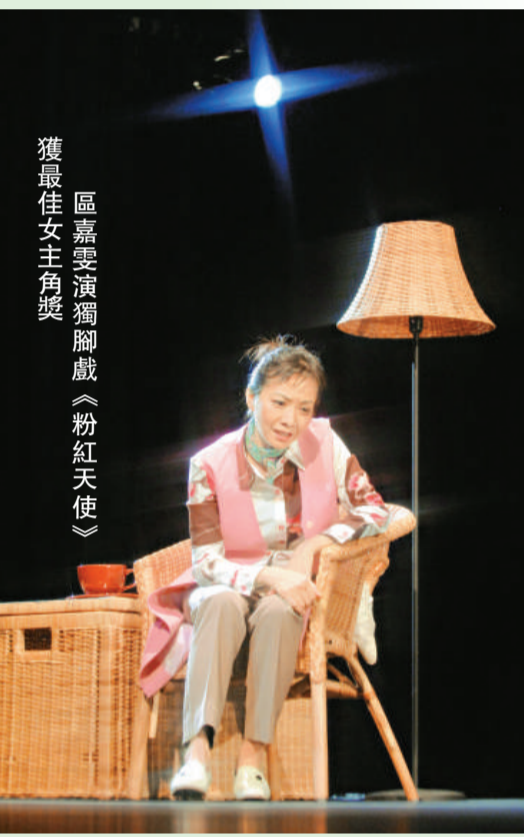
區嘉雯演獨腳戲《粉紅天使》獲最佳女主角獎