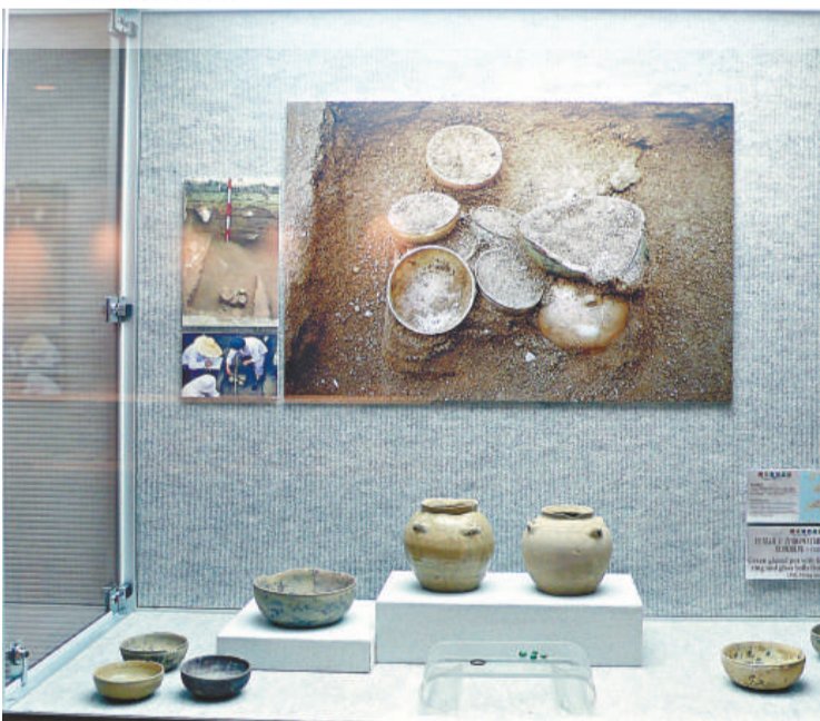
白芒遺址出土的青釉四耳罐、碗、碟、指及玻璃珠

「考古學的知識和樂趣，不應只限於考古學家，不同範疇的人亦可以參與。」鄧聰表示，考古不是純粹的人文學科，它與自然科學的關係密切，考古學家很多時都需要運用到