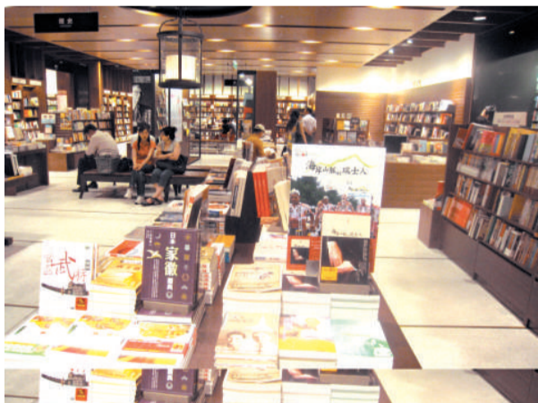
台北誠品書店旗艦店內景觀