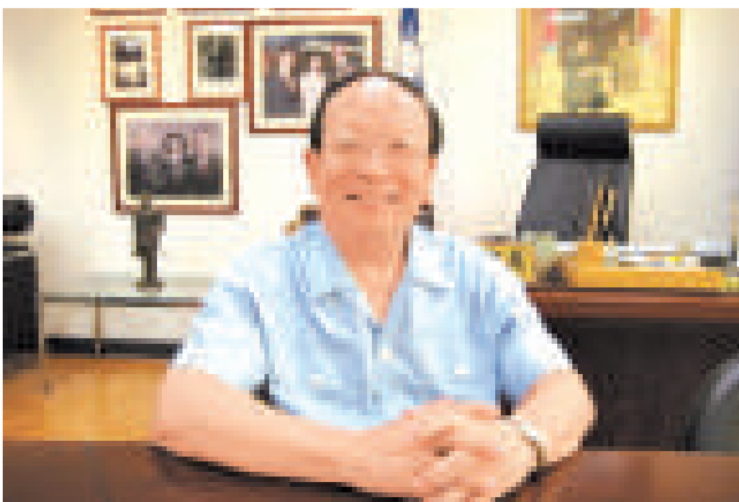
蔣孝嚴說，他的祖父蔣介石，絕對不是二二八事件的元兇（資料照片）