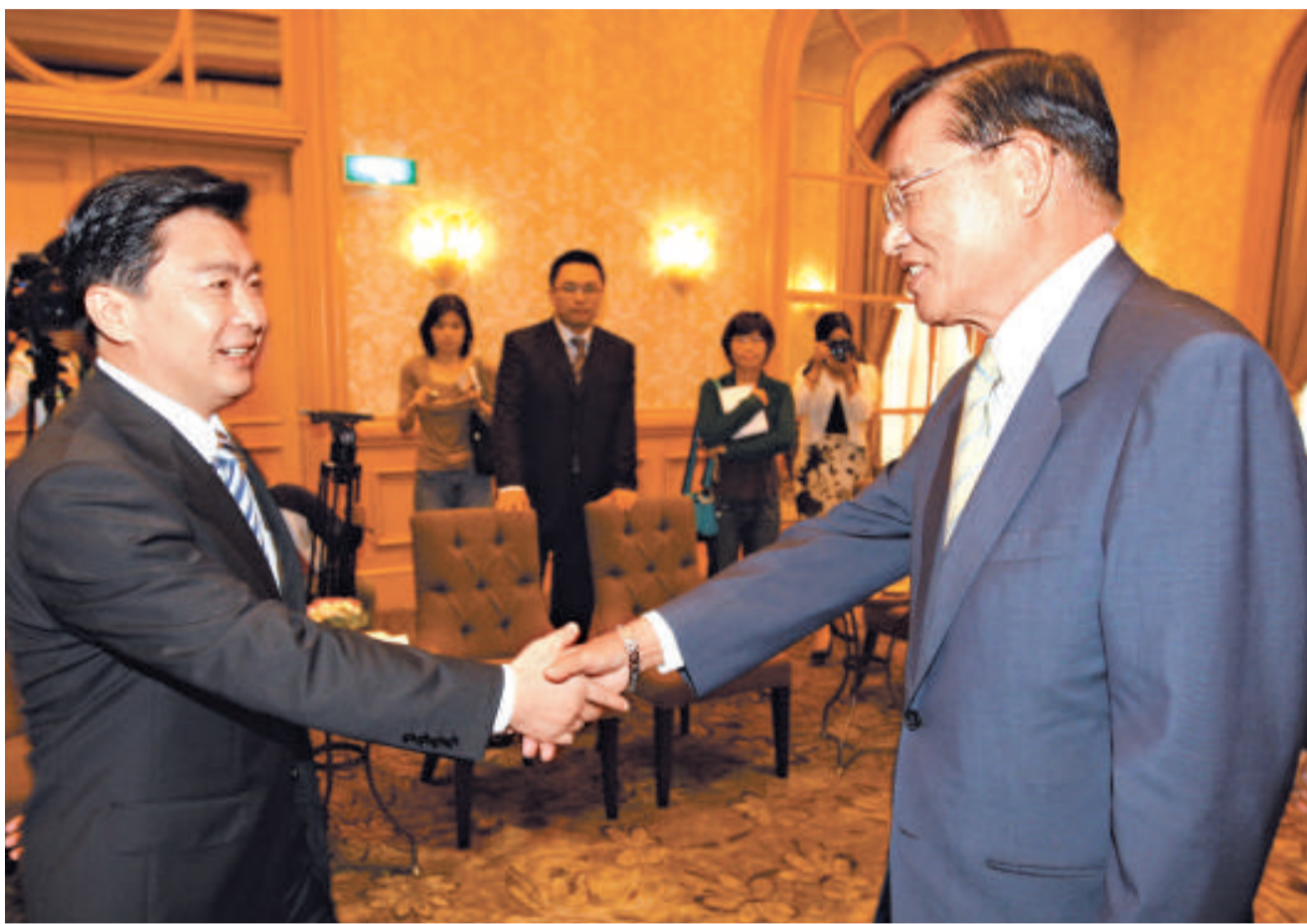
海基會董事長江丙坤（右）昨日會見蘇州市委書記王榮（左）一行人，盼訪問團在台行程順利成功

近期已經訪台、正在訪台、即將訪台的大陸高幹和重要人士，包括：上海市常務副市長楊雄、大陸新聞出版總署署長柳斌杰、海協會副秘書長王小兵等。大陸重要人士訪台絡繹於途，兩岸交流正在逐漸熱起來，形勢喜人。