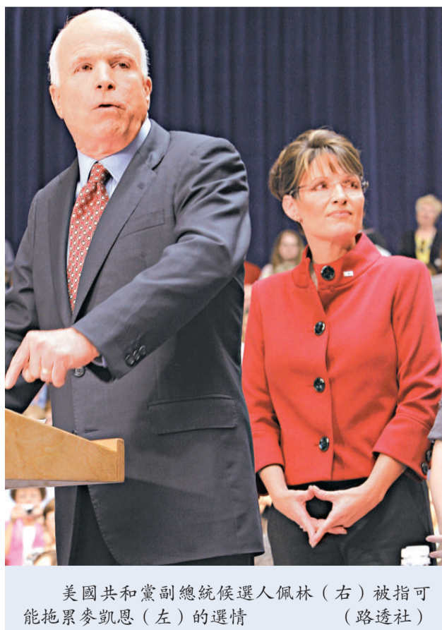
美國共和黨副總統候選人佩林(右)被指可能拖累麥凱恩(左)的選情

另一項由美聯社進行的民意調查，則顯示奧巴馬的支持率以百分之四十八，領先麥凱恩的百分之四十一。三個星期前的同一項民調是由麥凱恩輕微領先奧巴馬的。各種跡象顯示，麥凱恩的人氣有如江河日下。