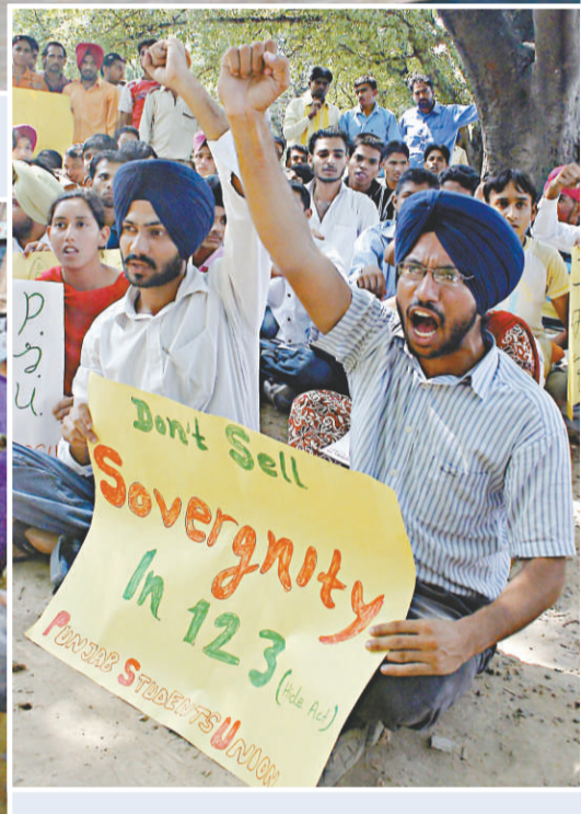
▲有不少反對印美民用核協議的人認為該協議是以印度的主權為代價換來的