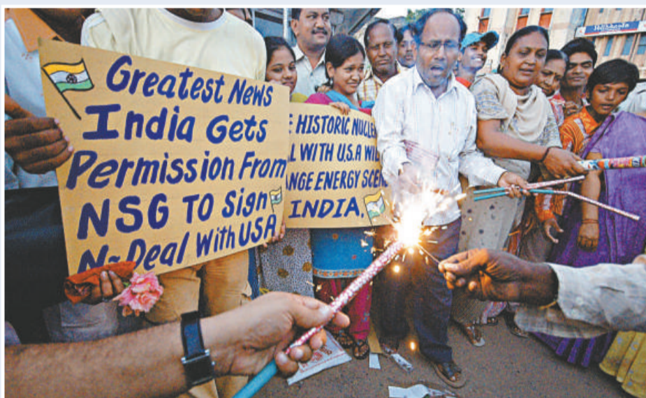
▲早於九月六日，印度群眾便已在街上慶祝印美民用核協議的審批進程順利