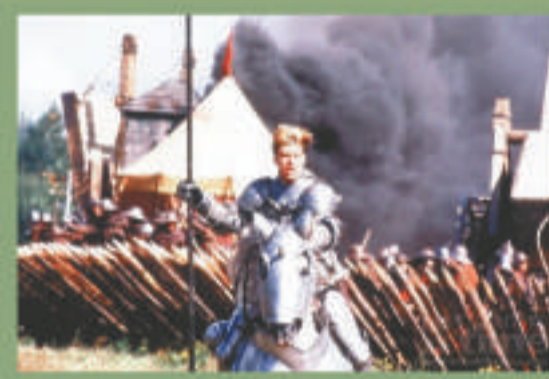
▲洛比桑執導的《聖女貞德》，予人壯烈凄美之感