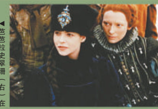
▲《奧蘭度》講述穿梭四百年的奇幻故事 ▲《奧蘭度》具科幻元素