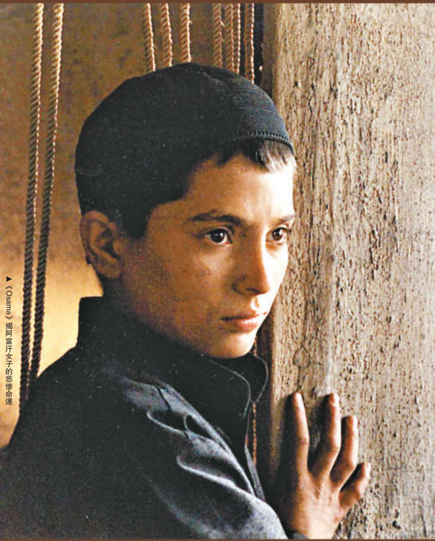
▲《Osama》揭阿富汗女子的悲慘命運

在女權運動並未開始受到重視的時代，女人除了待在家中打理家頭細務、帶帶孩子，做一個男人眼中賢良淑德的婦人，基本上「允許」能夠做的事情根本不多；因此，女人要衝破世俗種種枷鎖樊籬，唯有略施小計，以女扮男裝的姿態出現，用暫時的「男人」身份去完成她的夢想。