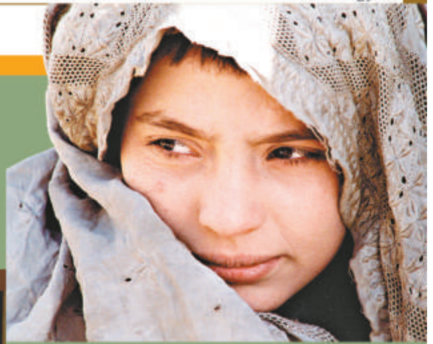
▲《Osama》在阿富汗取景 ▲希拉莉絲韻憑《沒哭聲的抉擇》在奧斯卡封后

在女權運動並未開始受到重視的時代，女人除了待在家中打理家頭細務、帶帶孩子，做一個男人眼中賢良淑德的婦人，基本上「允許」能夠做的事情根本不多；因此，女人要衝破世俗種種枷鎖樊籬，唯有略施小計，以女扮男裝的姿態出現，用暫時的「男人」身份去完成她的夢想。