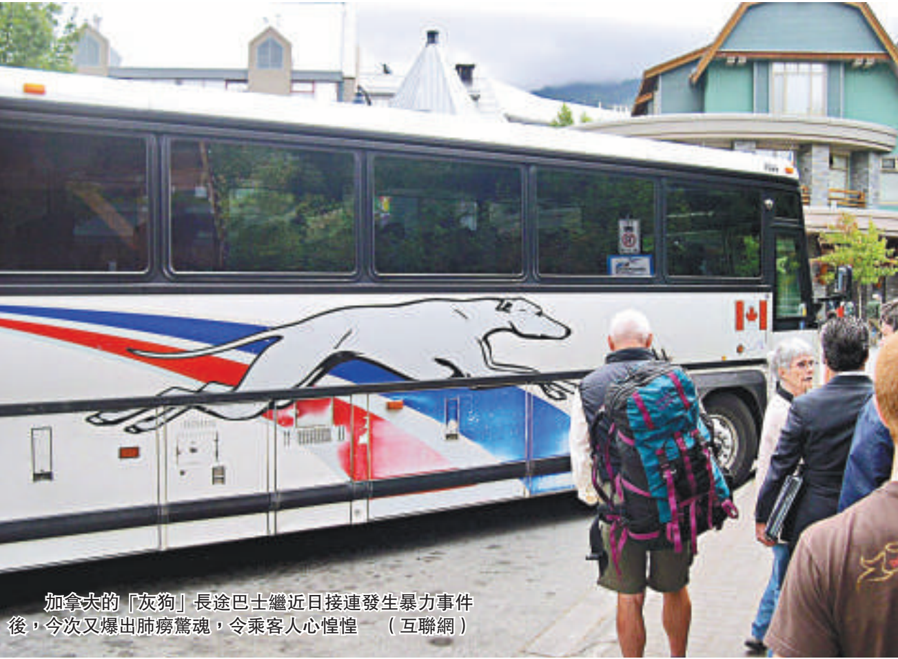
加拿大的「灰狗」長途巴士繼近日接連發生暴力事件後，今次又爆出肺癆驚魂，令乘客人心惶惶（互聯網）

加拿大灰狗巴士近期接連發生狂徒襲擊乘客事件，現在又爆發肺癆驚魂，可謂一波未平，一波又起。