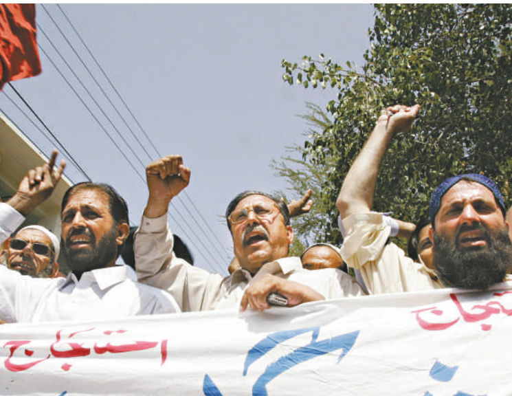
人民民族黨的支持者三日對於向該黨發動自殺式襲擊的恐怖行為表示不滿

【本報訊】綜合外電伊斯蘭堡三日消息：巴基斯坦掀起新一輪針對政黨領袖的炸彈襲擊。據巴基斯坦官方通訊社報道，巴人民民族黨領導人阿斯凡迪亞爾·瓦利·汗的位於西北部城鎮賈爾瑟達的寓所二日遭到自殺式爆炸襲擊，造成至少四人死亡，多人受傷。