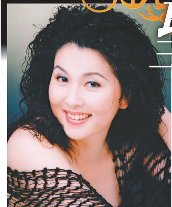
▲著名女高音饒嵐將助陣香港聖樂團