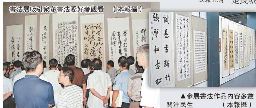
▲書法展吸引眾多書法愛好者觀看