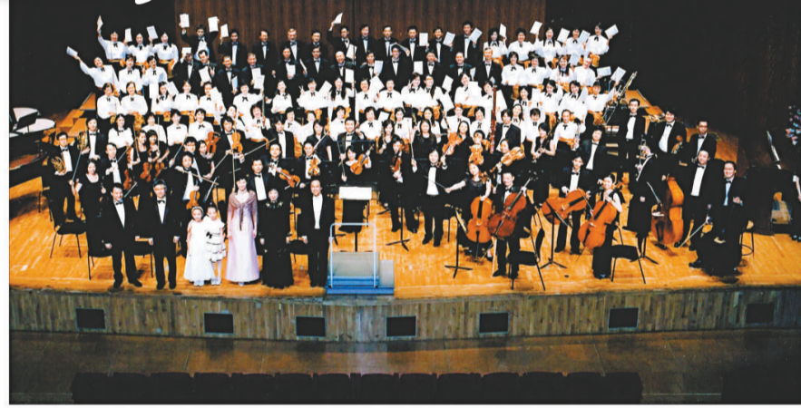
▲香港聖樂團十月五日獻演巴赫的康塔塔