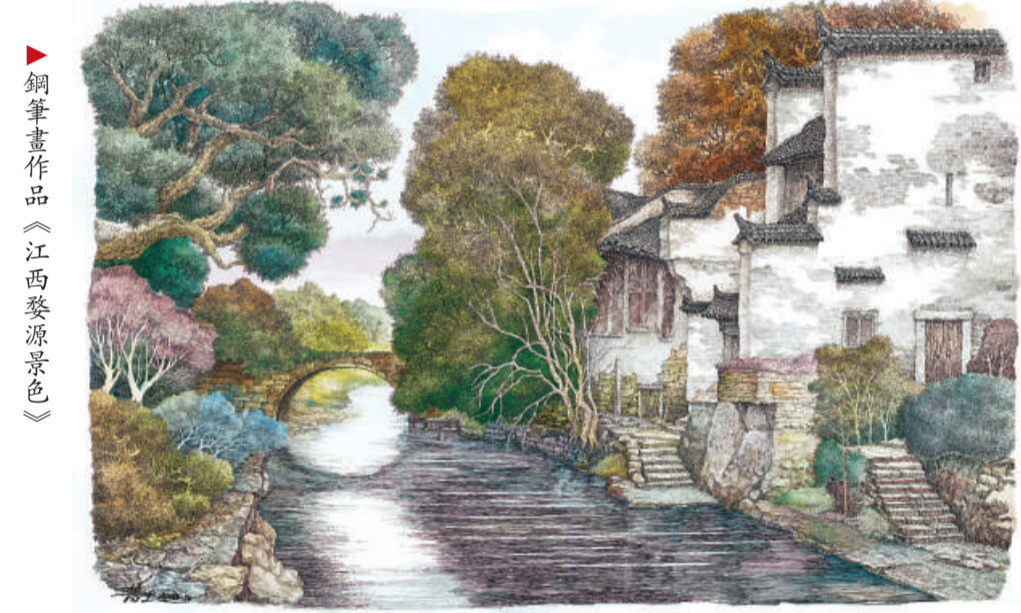
▲鋼筆畫作品《江西婺源景色》

年來，在大運河的一些河段沿岸，出現了房地產開發、進行商業、民用建設的趨勢。開發商利用運河沿岸優美的環境，大量開發建設項目，令運河周圍的環境、歷史風貌遭到破壞，為運河及其遺產的保護帶來了巨大壓力。時間一久，人們將無從判斷這道河究竟是具有上千年歷史的古運河，還是房地產商建設的一道景觀。為此，單霽翔認為，要保護運河遺產的本體及其環境，維護運河遺產的真實性和完整性。 揚州市市長王燕文表示，一年來，天津、河北等地組織文物工作者認真開展資源調查，基本摸清了境內大運河遺產資源的家底。今年三月，大運河沿線八個省、直轄市、三十三個地級城市政府共同組建了中國大運河保護與申遺城市聯盟，並就大運河保護規劃的編制與申遺達成了《揚州共識》，重點精心保護沿運河歷史遺迹和環境。在保護運河沿線歷史遺蹟的同時，加強對與運河相生相依的古城、古鎮、歷史街區等歷史環境、歷史風貌的全面保護。