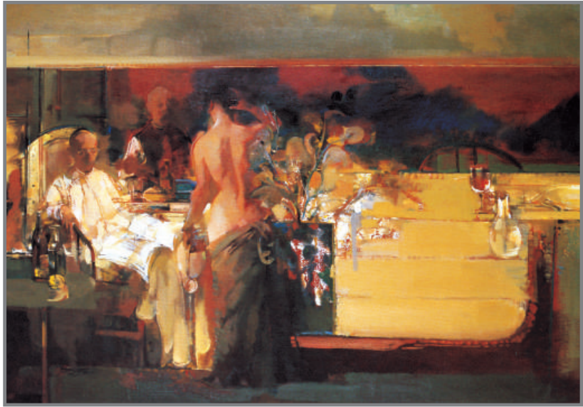
姜建忠 西洋文化 1999年 布面油畫

展望 1962 出生於北京。1978 年考入北京工藝美術學校特藝專業學習。1983 年考入中央美術學院雕塑系。1993—1996 年獲德國 DAAD 特別藝術獎學金，在德國紐倫堡藝術學院雕塑研究班進修。1994 年在北京定福莊設個人工作室，並在波恩舉辦個人作品介紹展。1995 年與德國著名雕塑家馬克思木埃特在波恩舉辦雕塑作品聯展。1997 年參加「平津戰役」大型浮雕創作。1998 年作品《距離》參加「中國當代藝術觀摩展」。 隋建國 1956 出生，山東青島人。1984 年畢業於山東藝術學院美術系，1989 年畢業於中央美術學院雕塑系研究生班，現為中央美術學院雕塑系副主任、教授。作品曾參加 1984 年全國首屆城市雕塑設計展、1992 年當代青年雕塑家邀請展、1993 年威海國際雕刻大賽、1994 年台北海峽兩岸雕塑交流展、1995 年巴塞羅那中國當代藝術展等，並曾在北京、台北、日本舉辦個人作品展和雙人展。部分作品為國內外藝術機構所收藏。 展望、隋建國都是最早從事當代雕塑實驗與創作的代表人物，公眾看到的大都是這方面的比較前衛的創作，但在 1997 年由展望和隋建國接受委託為西柏坡博物館共同創作完成的「五大書記」像，則是完全現實主義的創作。原作是一個為放大製作的稿件，放大銅雕作品現安置於河北省西柏坡博物館門前。 作品反映了五大領袖進京之前的精神風貌，以寫實的手法着力刻劃出每個人物的神情與動態，是個性化、人格化的體現。