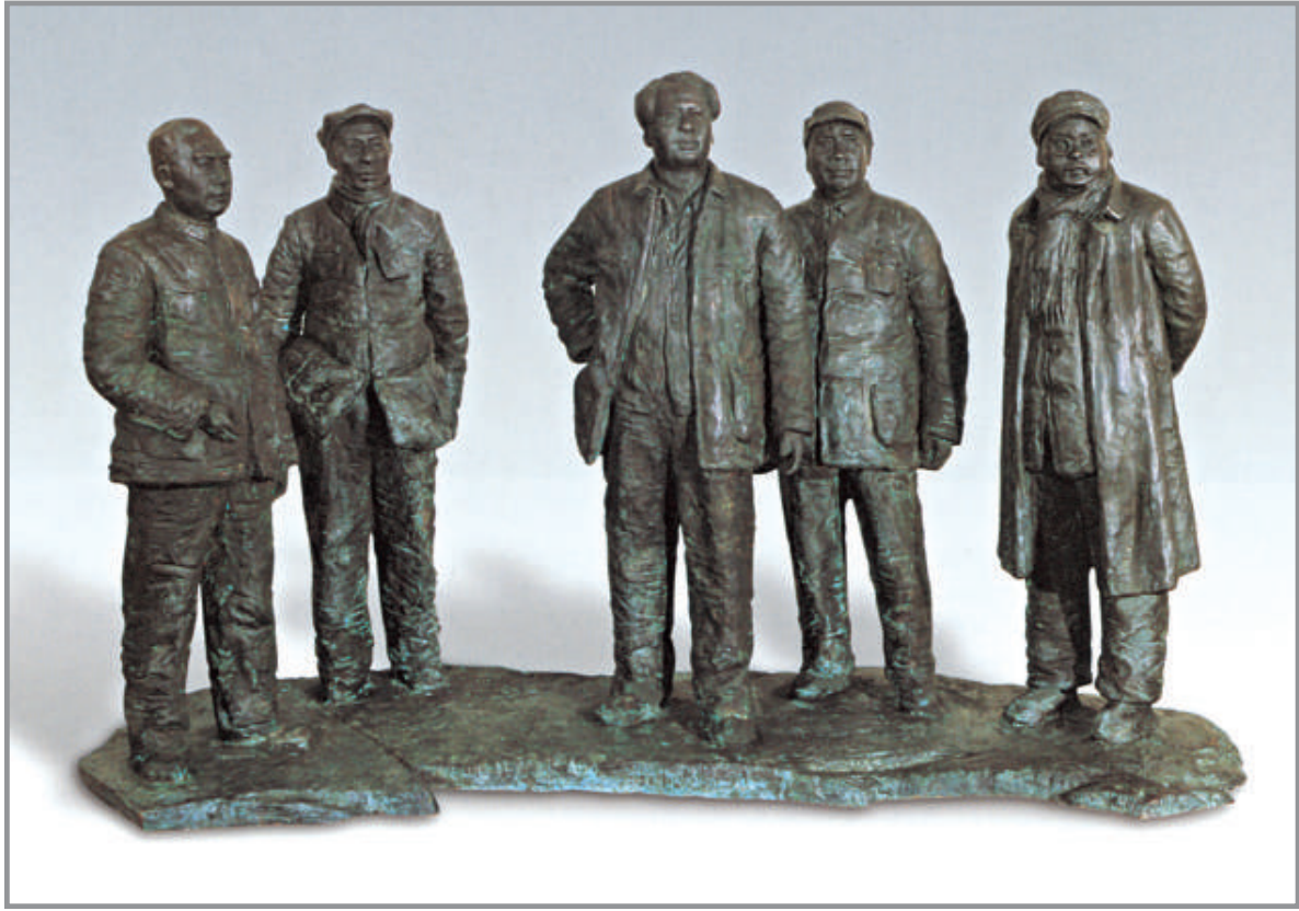
展望 隋建國 向着勝利前進——五大書記像 1997年 銅雕

展望 1962 出生於北京。1978 年考入北京工藝美術學校特藝專業學習。1983 年考入中央美術學院雕塑系。1993—1996 年獲德國 DAAD 特別藝術獎學金，在德國紐倫堡藝術學院雕塑研究班進修。1994 年在北京定福莊設個人工作室，並在波恩舉辦個人作品介紹展。1995 年與德國著名雕塑家馬克思木埃特在波恩舉辦雕塑作品聯展。1997 年參加「平津戰役」大型浮雕創作。1998 年作品《距離》參加「中國當代藝術觀摩展」。 隋建國 1956 出生，山東青島人。1984 年畢業於山東藝術學院美術系，1989 年畢業於中央美術學院雕塑系研究生班，現為中央美術學院雕塑系副主任、教授。作品曾參加 1984 年全國首屆城市雕塑設計展、1992 年當代青年雕塑家邀請展、1993 年威海國際雕刻大賽、1994 年台北海峽兩岸雕塑交流展、1995 年巴塞羅那中國當代藝術展等，並曾在北京、台北、日本舉辦個人作品展和雙人展。部分作品為國內外藝術機構所收藏。 展望、隋建國都是最早從事當代雕塑實驗與創作的代表人物，公眾看到的大都是這方面的比較前衛的創作，但在 1997 年由展望和隋建國接受委託為西柏坡博物館共同創作完成的「五大書記」像，則是完全現實主義的創作。原作是一個為放大製作的稿件，放大銅雕作品現安置於河北省西柏坡博物館門前。 作品反映了五大領袖進京之前的精神風貌，以寫實的手法着力刻劃出每個人物的神情與動態，是個性化、人格化的體現。