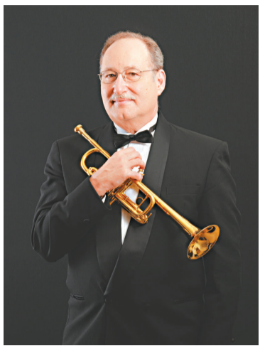
香港小交響樂團的「銅皮鐵骨兄弟班」美國小號演奏家湯普森

【本報訊】銅管樂器閃閃生輝的外表，濃厚廣闊又開朗調皮的雙重性格，吸引了不少聽眾、演奏家和作曲家，不論是古典或流行音樂，百老匯或爵士樂，都少不了銅管樂的份兒。美國小號演奏名家湯普森將聯同香港小交響樂團的「銅皮鐵骨兄弟班」，與聽眾分享銅管樂的風采。