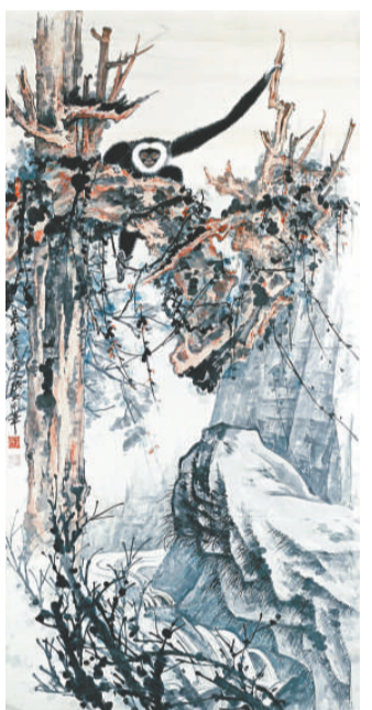
張大千的《老樹騰猿》，以六百二十六萬元成交