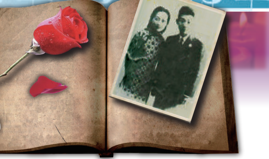
▲郁達夫與杭州美人王映霞的婚戀為人津津樂道