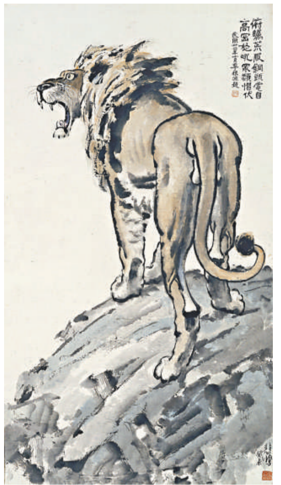
徐悲鴻的《高崗獅吼》，以五百三十萬元成交