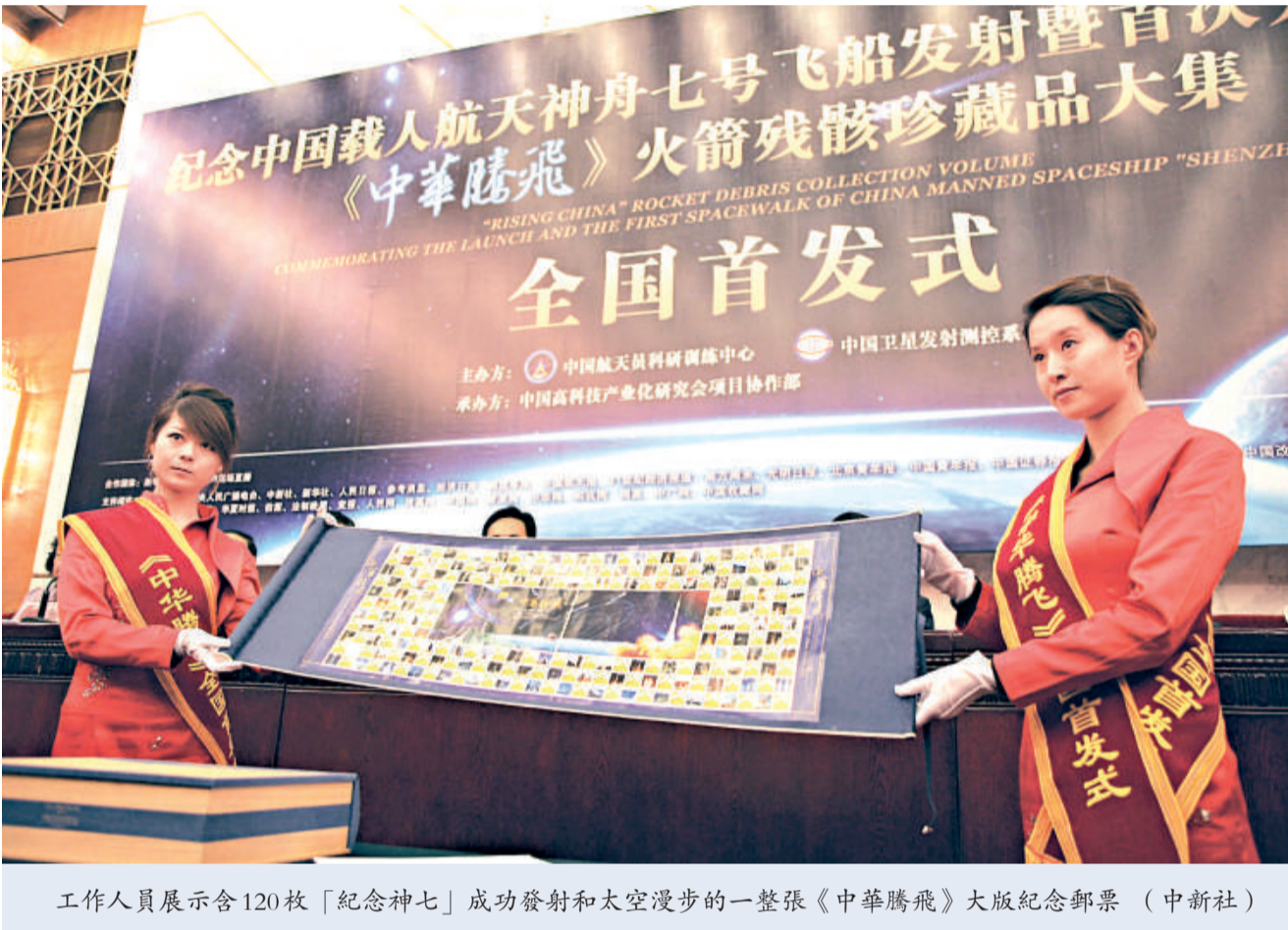
工作人員展示含120枚「紀念神七」成功發射和太空漫步的一整張《中華騰飛》大版紀念郵票