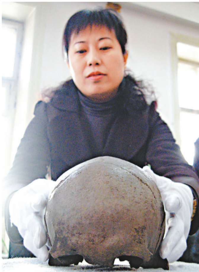
哈爾濱市文物管理站的工作人員昨天在展示其中一件罕見的古代人頭骨