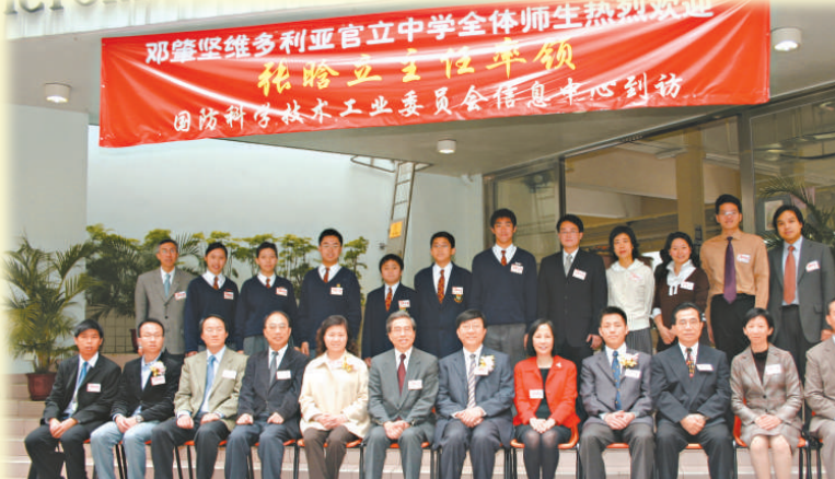
國防科學技術工業委員會信息中心於二〇〇六年到訪後，即授權開辦「航天科普課程」，使學校成為全港唯一開辦此課程的先導學校