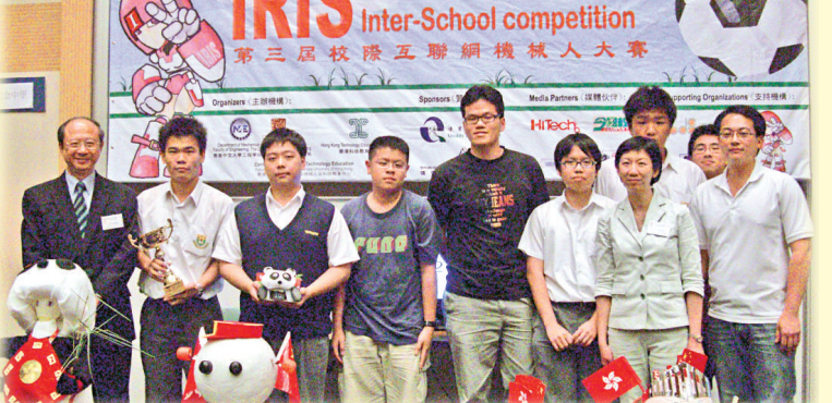
維官代表隊榮獲「第三屆校際互聯網機械人大賽」創意機械人組別的冠軍