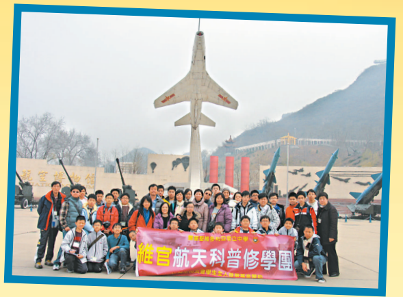
2008年維官航天科普修學團成員參觀航空博物館