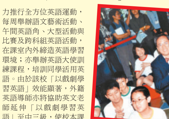
行政長官曾陳權先生曾來參觀學生上英語戲劇課