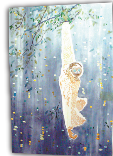
《幻象》中，猴子的背景是 高廈的霓虹燈光