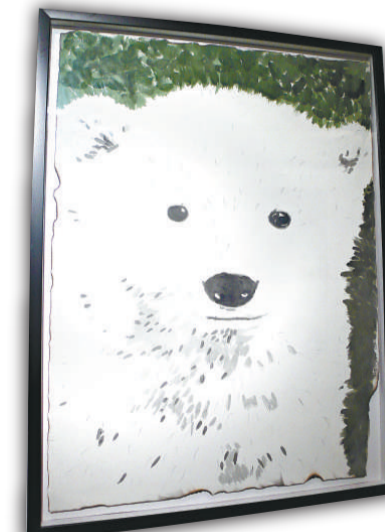
林東鵬參觀 柏林動物園後， 畫下可愛的小白 熊克努特，畫紙 邊燙燒過，給人 一種危機感