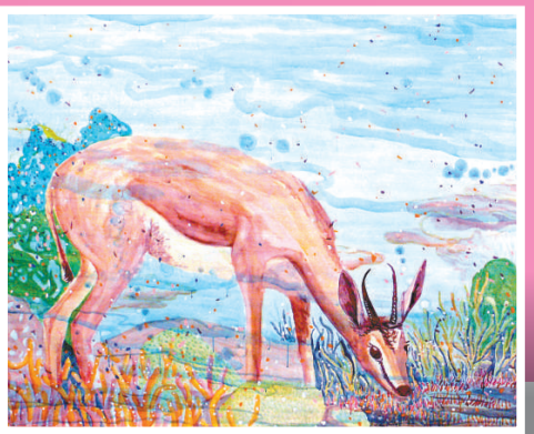
《逐鹿水中》意象矛盾又夢幻