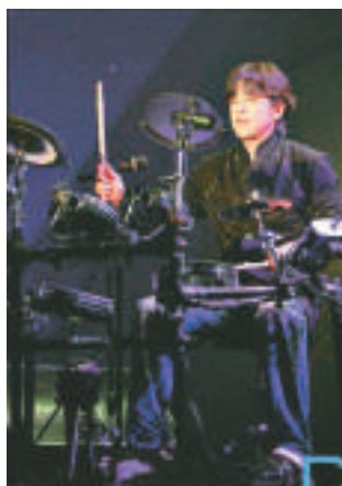
▲柳時元舉行盛大生日會，吸引韓國及亞洲各地的影迷參與 ▶柳時元的生日會以迷你演唱會的形式進行

人氣男星柳時元在十月五日於首爾市奧林匹克公園舉行盛大生日會，當日除韓國影迷外，更有來自日本、香港、台灣、菲律賓等地共三千多名影迷參與。生日會以迷你演唱會的形式進行，其後他更和嘉賓歌手Zero合唱。另外，柳時元也將在本月十四日出席韓國旅遊日紀念儀式，屆時並將獲總統李明博親自頒授嘉許狀，表揚他對宣傳韓國旅遊的貢獻。