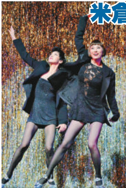
▲米倉涼子（右）演出舞台劇《芝加哥》，載歌載舞