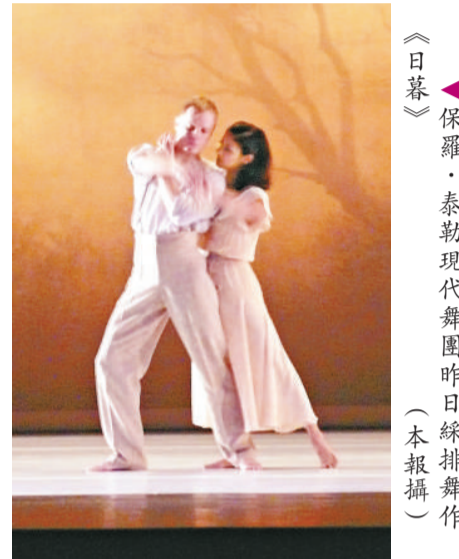
▲《日暮》保羅·泰勒現代舞團昨日彩排舞作