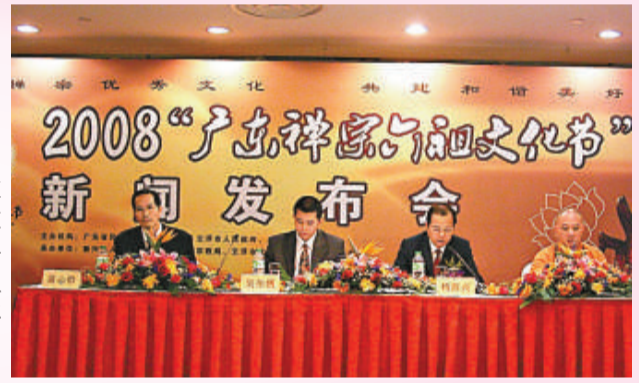
首屆廣東禪宗六祖文化節新聞發布會現場