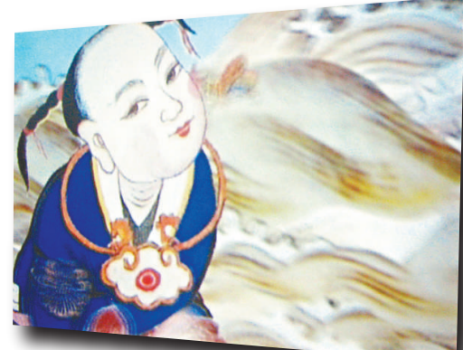
《dream》以中國的年畫等傳統造型為原型的動畫作品