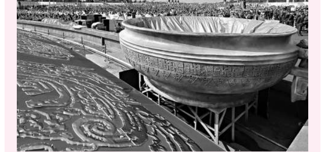
12日，安徽銅陵舉辦青銅文化博覽會，展出著名出土青銅器「春秋鑿」的仿製品

救治人員分析，「帕賈」現在吃的主要是蘆葦桿、紅薯籐、芭蕉桿。進入秋季，這些食物已經老了，其植物纖維被大象吃進去後，沒有消化，摻和在糞便裡而堵塞了腸道。救治人員估計，「帕賈」身體完全恢復還需要一周時間。