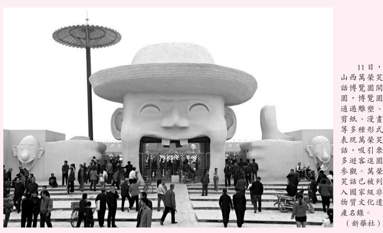
11日，山西萬榮笑話博覽園開幕，博覽園通過雕塑、剪紙、漫畫等多種形式表現萬榮笑話，吸引眾多遊客進園參觀。萬榮笑話已被列入國家級非物質文化遺產名錄。

「在國際範圍內，OLED技術經過20年的發展已經進入到產業化階段，也呈現出向大尺寸方向發展的趨勢。」邱勇說。