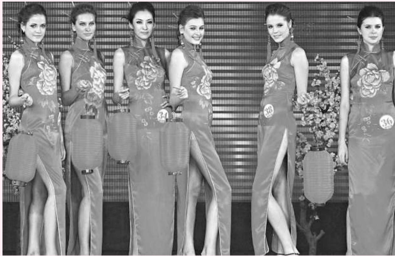
11日晚，「2008中國燕郊世界名模大賽」總決賽在河北燕郊舉行，來自德國、澳洲、英國和中國的20多個國家和地區的40位選手參加了決賽，展示出世界頂級職業模特的風采。圖為參賽的各國模特展示中國旗袍風采