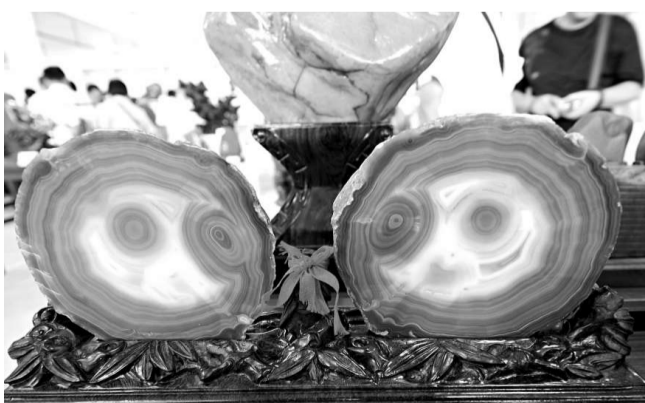
一位收藏家展示的「學生熊貓」奇石（新華社）

「中華石都」廣西柳州是中國和東南亞最大的奇石集散地，這裡的台山彩陶石、大化彩玉石、三江石和卷紋石蜚聲中外。在各大奇石市場裡，各種涵天地之精華、縮山川之美妙的千姿百態的奇石，那些似人似物栩栩如生的奇石，吸引著各地的石癡和愛石的風雅之前來淘寶。