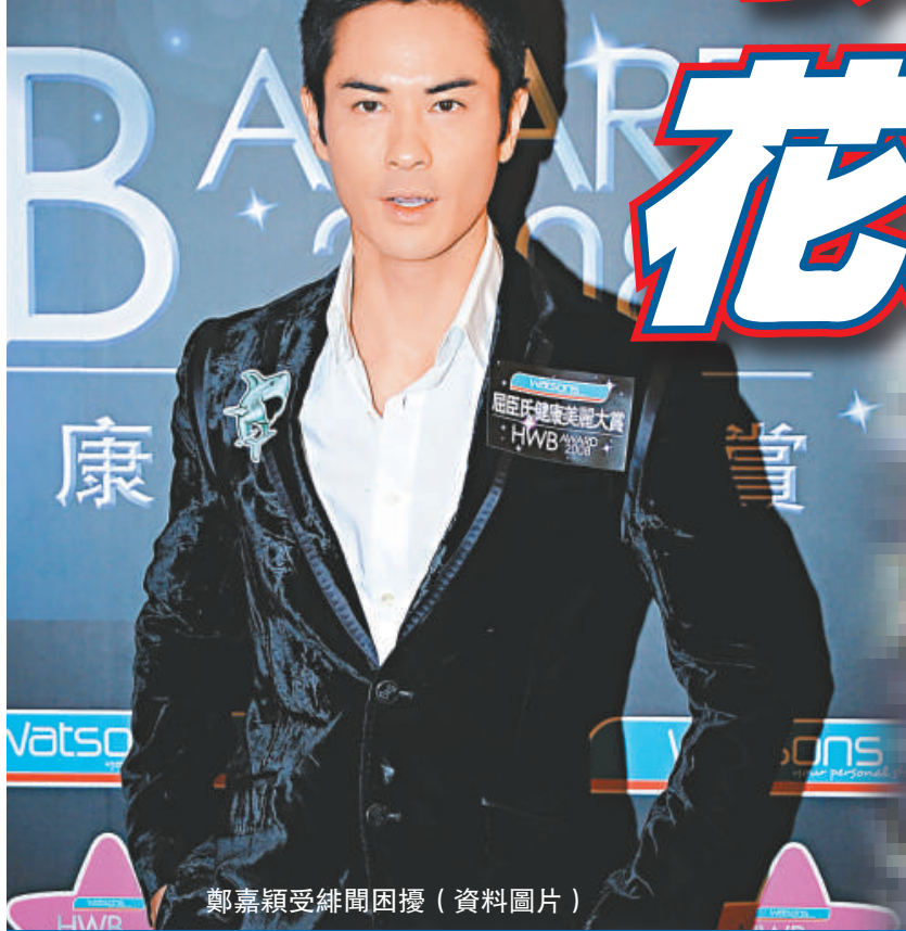
鄭嘉穎受緋聞困擾 (資料圖片)