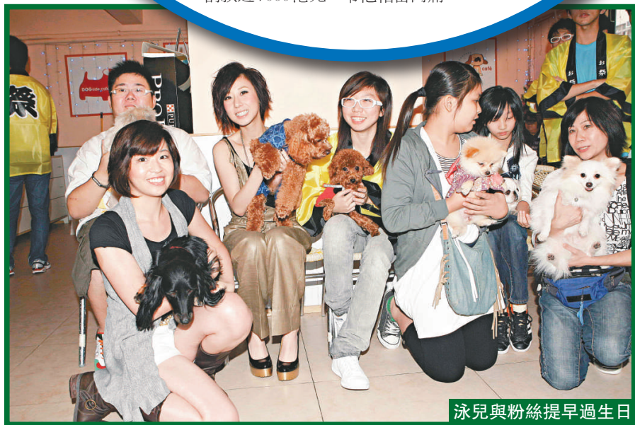
泳兒與粉絲提早過生日