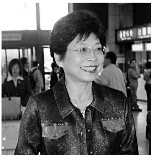
觀光局長賴瑟珍十三日率領一百多家台灣旅遊業者，前往北京和南京舉辦旅遊推廣說明會

至於航班和航點，賴瑟珍指出，目前百分之八十五的赴台大陸觀光客，都是來自直飛航點的省市，希望海協會會長陳雲林訪台，對於兩岸航班和航點的增加，可以有關鍵性的影響力。她表示，期望在今年底之前，兩岸的航班和航點可以增加，大陸赴台觀光人數也可以從現在的每月一萬人，增加到每月兩萬人。