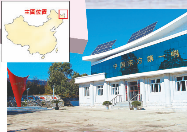
▲黑瞎子島回歸後，位於撫遠縣烏蘇鎮的「東方第一哨」將會遷移到黑瞎子島上