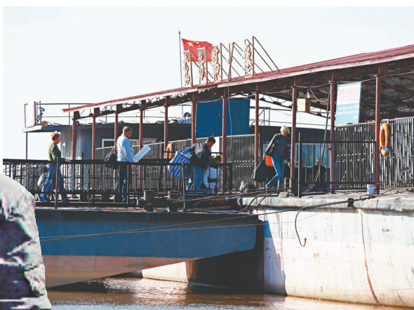
▲在撫遠口岸的東方第一港，滿載而歸的俄羅斯人踏上回家的輪船