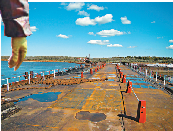
▲中方搭建中的通往黑瞎子島的浮橋

十四日，中俄雙方將在黑瞎子島上舉行「中俄界碑揭牌儀式」。圖為十三日中俄雙方有關人員在黑瞎子島上為揭牌儀式作準備