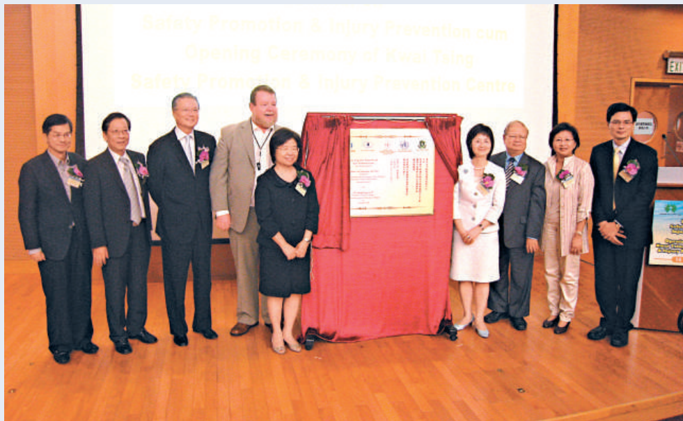
葵青安全促進及傷害預防中心昨舉行揭幕禮