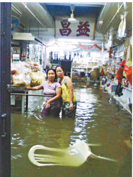
上月大澳嚴重水浸，不少民居被水淹（資料圖片）

以下網頁： www.lordwilson-heritagetrust.org.hk/chi/app/index.htm 。