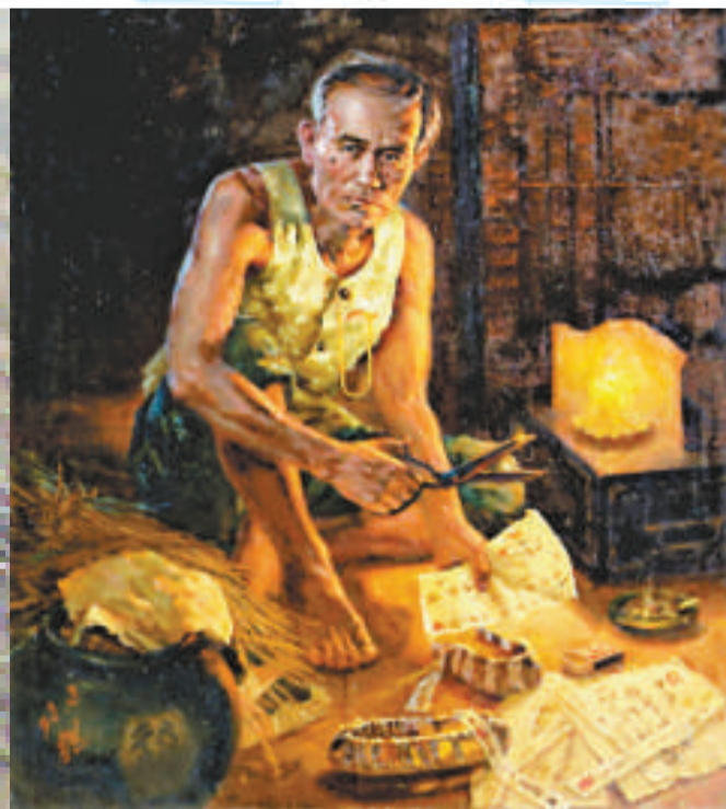
▲《本性》，布面油畫，1993年，崔哲民