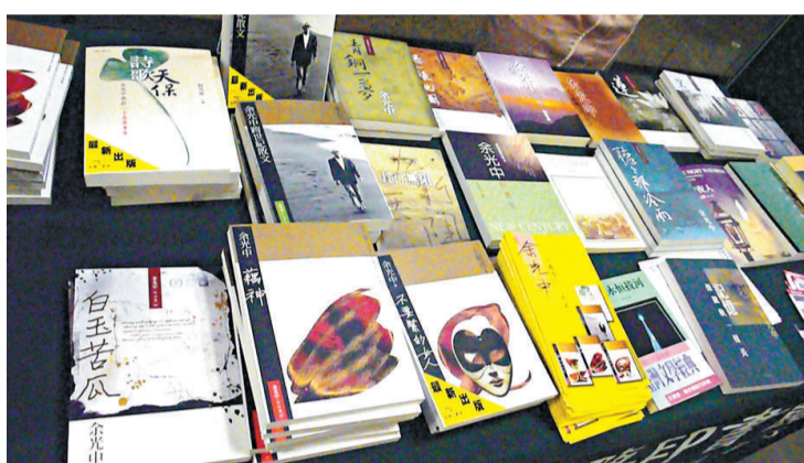
▲余光中八秩壽辰，著作等身

【本報訊】記者洪捷報道：著名詩人余光中生於一九二八年，踏入今年十月，已屆八十歲了，但他的愛戴者卻不分男女老幼，追捧者衆。前晚（十月十三日）於商務印書館舉行的「余光中八秩壽慶紀念典藏作品分享及簽名會」，便吸引了百多名讀者出席，當中不乏穿着校服的中學生。