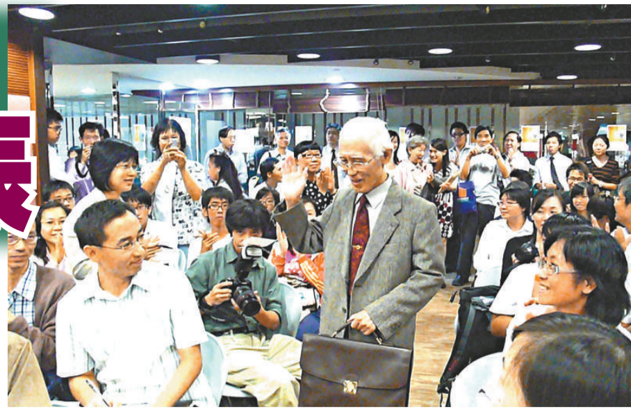
▲余光中風塵僕僕由出生地南京趕抵香港與讀者會面

余光中昨日已回台灣，他將於十二月中再度來港，出席於香港中文大學圖書館舉行的慶祝八十周歲有關展覽，屆時會展出余光中的著作、手稿、圖片。