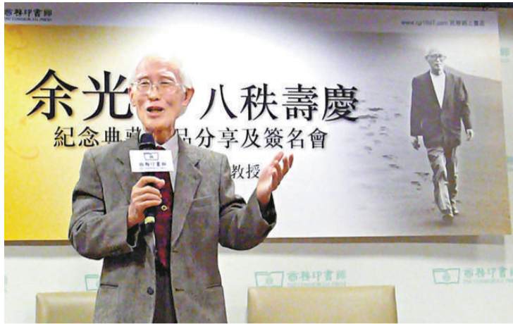
▲余光中在分享會中幽默風趣，讀者耳福不淺