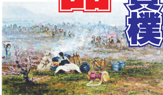
▲《開墾》，布面油畫，1957年，崔道淳

上衣的主人公想盡量把自己打扮成農民，不過胸前掛着的金表暴露了身份，他舉起剪刀卻又不捨揮剪。這種神情浮現在他的臉龐，在燦爛的映襯下有些呆滯。朝鮮白虎創作社（相當於國家美協）成員徐英浩一九九五年所作的《抗稅的朝鮮人民》，畫的也是五十年前的故事題材。