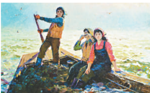
▲《海的女兒》，布面油畫，1978年，朴京熙

從這次大展覽上的相關作品來看，也正是這些老畫家，自覺地將朝鮮人民在反擊侵略時期（一九五零年至一九五三年）、戰後恢復時期（一九五四年至一九五六年）和經濟建設初期（一九五七年至一九五八年）等各個革命時期及生活，按照朝鮮「主體思想」原則，作了激情而深刻的現代性記錄。在歷史主題畫創作中展現了一種大氣的英雄主義，在工農題材畫創作中展現了一種質樸的生活氣息，在山野風景畫創作中則又展現了朝鮮人民固有的和平願景和寧靜心態。而這批老一輩的油畫家創作為朝鮮一九七〇年代繪畫藝術創作的高潮提供了現實主義思想基