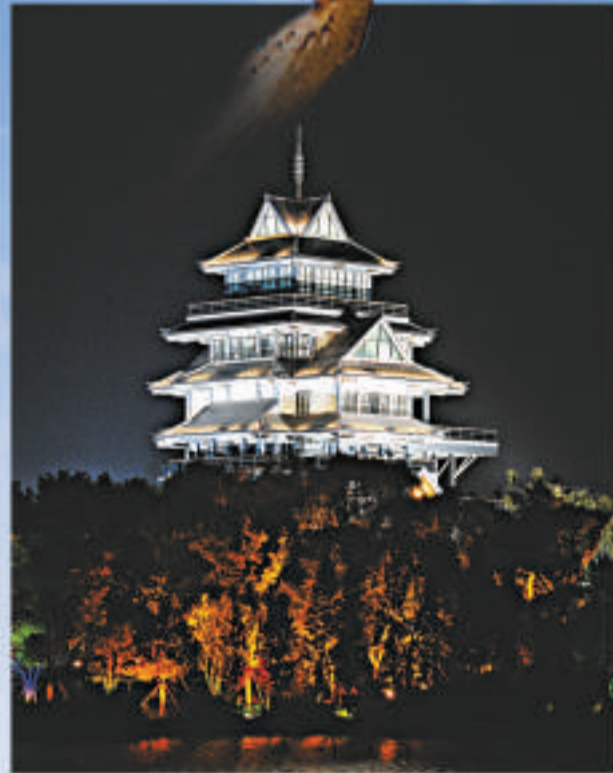
飛簷翹角的重元寺觀音閣

無論是白天還是夜晚，遊客在這裡都可以享受到適合自己的休閒方式。蘇州本土的得月樓開出李公堤形象店，寬敞的觀景房，融合中式元素，並首推「得月樓全蟹宴」；媒體園午餐的「吳地人家」是一家崑崙主題酒店，以「原味蘇州、風雅吳地」為宗旨，裡面的菜名和包廂都與崑崙曲目有關，別有一番情致；古色古香的春蕾茶莊，品茶會友，不僅有蘇式茶點，還有評彈小曲助興；全天候的「楓橋軒音樂主題餐吧」，既可以享用特色茶館，每晚還有歐洲風情的樂隊駐場表演，極具浪漫情懷；來自比利時的布魯塞爾巧克力吧、美茶餐廳、玉禪紅酒咖啡，隨便走進哪一家都可以體驗放鬆心情，為自己放個假，坐在落地窗前欣賞窗外的園區美景。