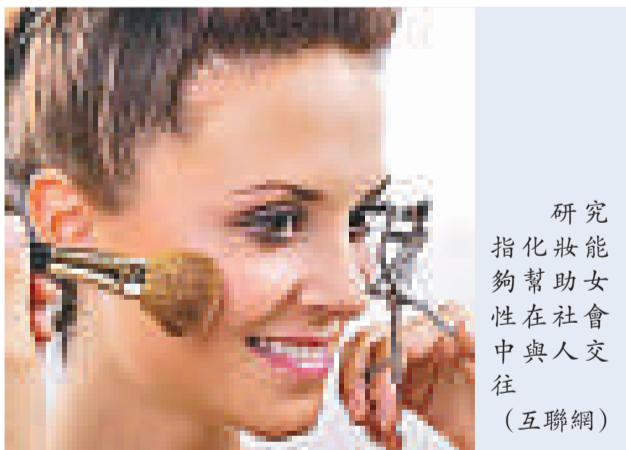
研究指化妝能夠幫助女性在社會中與人交往

茂木健一郎認為，化妝意味著如何把自己展示給他人，展現給社會，也是「自我的社會形象建設」，因此化妝在加深女性與社會的聯繫上發揮著重要作用。