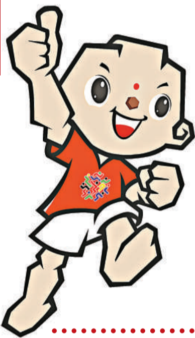
▲十一運會吉祥物「泰山童子」

第十一屆全運會將於2009年10月11日在濟南開幕，這是北京奧運會後中國體育發展成果的一次大檢閱。