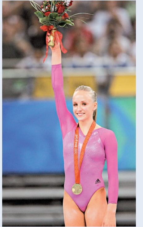
▲柳金在北京奧運會體操項目一鳴驚人

【本報訊】據新華社華盛頓十四日消息：總部設立於美國的女子體育基金會14日宣布，北京奧運會的女子體操全能冠軍柳金當選本年度的世界最佳女運動員。