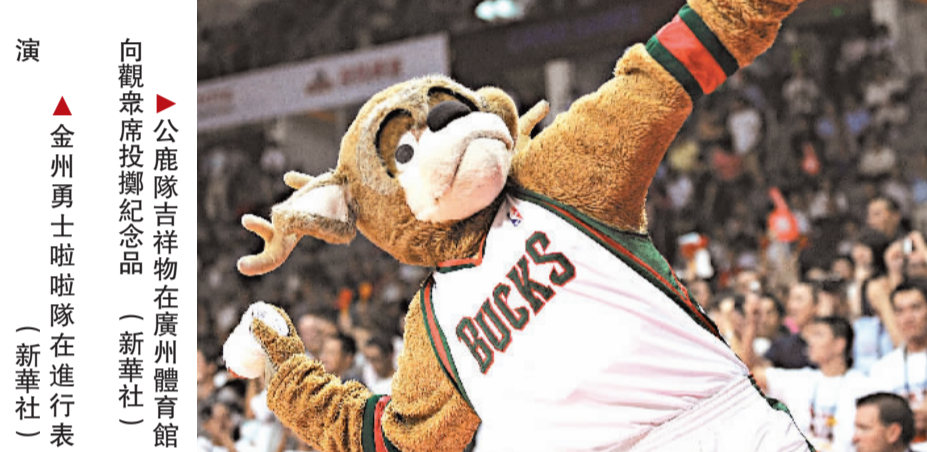
▲公鹿隊吉祥物在廣州體育館向觀眾席投擲紀念品 (新華社) ▲金州勇士啦啦隊在進行表演 (新華社)