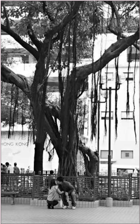
港榕情」攝影比賽得獎作品）

屋邨裡至今仍保留有戶外大排檔，充滿地道的食肆風味色彩。大家有空不妨前往光顧，感受一番。