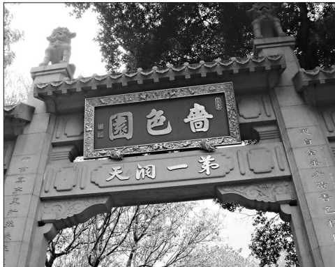
正式命稱為「黃色園」