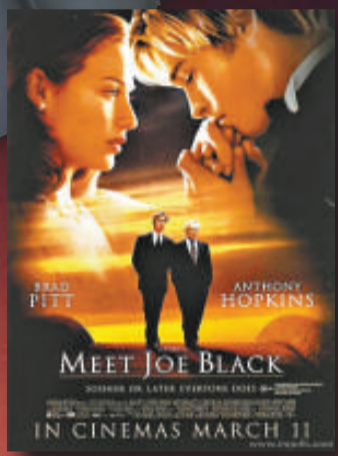
《情約今生》由馬田比爾斯執導