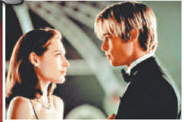
《情約今生》的賣點為畢彼特（右）飾演的靚仔死神

在即將公映的日本片《甜言蜜語》（改編自伊坂幸太郎的推理小說《Sweet Rain 死神的精確度》）中，風靡亞洲的英俊男星金城武，在戲中就扮演一位名叫千葉的死神，他需要去到人間觀察目標人物，然後用七日時間來決定對方的命運。電影就是圍繞他穿越三個年份（1985年、2007年及2028年）執行三個任務而發生。