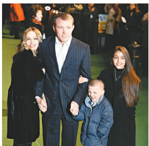
麥當娜（左起）、基里奇攜Rocco及Lourdes現身公開場合，此情不再

正在舉行巡迴演唱的麥當娜在宣布離婚後，當晚便在波士頓開騷，在約二萬名「粉絲」面前又唱又跳，認真專業。當她在唱出講述一對戀人分手的《Miles Away》之前，她說：「少數人會