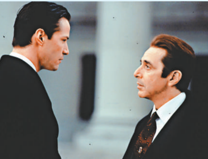
阿爾柏仙奴（右）在《追魂交易》中引領男主角墜落深淵

如果要數一個可以媲美金城武的俊俏「西方死神」，必定是《情約今生》（Meet Joe Black）裡的畢彼特（Brad Pitt）吧！這齣由馬田比爾斯（Martin Breast）執導的電影，拍於一九九八年，講述一位純真的天使死神初次來到人間，不但嘗到花生醬的美味，更加體會了前所未有的