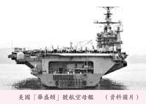
美國「華盛頓」號航空母艦 (資料圖片)

報道引述防衛省官員稱，二〇〇六年十月，中國傳統動力型核子攻擊潛艦曾在琉球海外海跟蹤「小鷹號」，並在約八公里的魚雷射程內浮上水面，這次中國潛艦也可能想展開類似的示威行動。