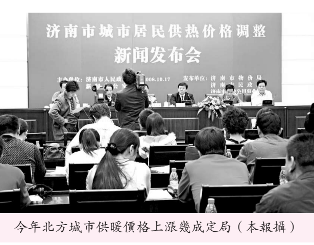
今年北方城市供暖價格上漲幾成定局 (本報攝)

按照國家規定，居民供熱價格調整要按照政府、企業和用戶共同分擔的原則分步調整。濟南市此次價格上調中，居民承擔了其中的20%，其餘部分由政府和企业共同承擔。而北京市今年也將繼續加大對居民用暖補貼力度，市區財政將投入22億元減少市民熱費支出。