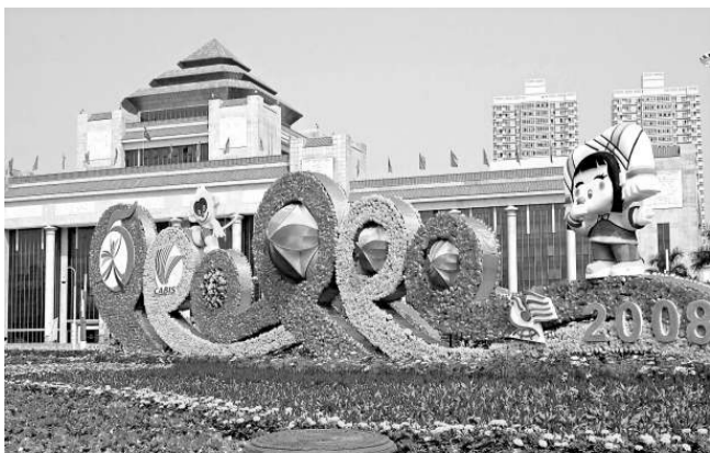
第五屆中國—東盟博覽會將於22日至25日在南寧舉行，當地營造出「花團錦簇」的園林景觀烘托喜慶氣氛

據悉，滬上最大的醫院便民服務中心將於本週六在新華醫院正式對外運行。這個綜合服務站將導醫和預檢功能整合在一起，提供「一站式」信息諮詢服務；專項服務台可提供檢查、門診和住院的預約辦理、檢查報告查詢等服務，減少患者奔波；門診信息管理系統不僅將各類預約服務功能整合到專項服務台集中提供，新開發的網絡化多點取號系統還解決了多流向、多地點排隊取號難題。發票中藥業清單打印的改進、住院預約登記的網絡化操作等信息化手段，保證了便民服務中心各項流程的便捷和暢通。