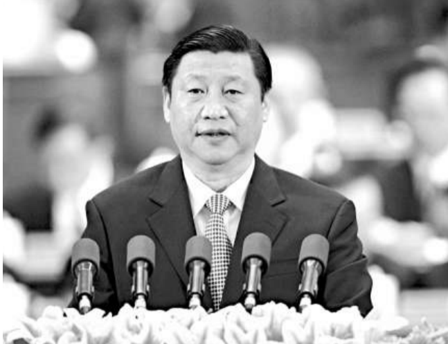
中國工會第十五次全國代表大會17日在北京人民大會堂開幕。這是習近平在致詞

習近平強調，要在黨和政府主導的維護職工權益機制中發揮工會的特點和優勢，切實維護職工合法權益，大力加強源頭參與，推動形成利益協調、訴求表達、矛盾調處和權益保障機制，推動健全以職代會為基本形式的企業單位民主管理制度，全面維護職工經濟、政治、文化、社會權益，進一步發展社會主義和諧勞動關係。