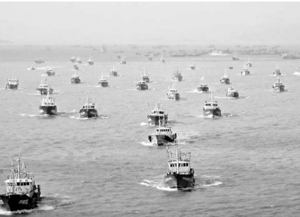
中國漁船近年活躍於周邊海域，引發出越來越多的漁業糾紛 (資料圖片)

【本報訊】據中國政府網消息，中國國務院辦公廳日前下發了關於加強漁業安全生產工作的通知，要求漁業執法機構加強在重點敏感海域的巡邏護漁、監管檢查工作，禁止漁船違規進入敏感爭議水域作業。