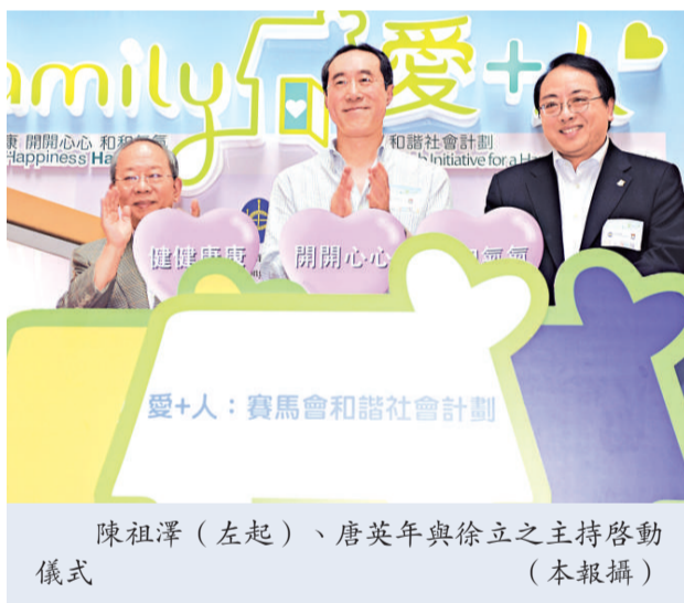
陳祖澤（左起）、唐英年與徐立之主持啓動儀式

【本報訊】記者黃雪峰報導：賽馬會計劃斥二億五千萬港元，與香港大學公共衛生學院合作推動「愛+人：賽馬會和諧社會計劃」，為二萬戶家庭進行問卷調查，以研究本港家庭觀念與家庭成員關係的態度轉變。政務司司長唐英年期望，調查資料可助制定適合的家庭政策。