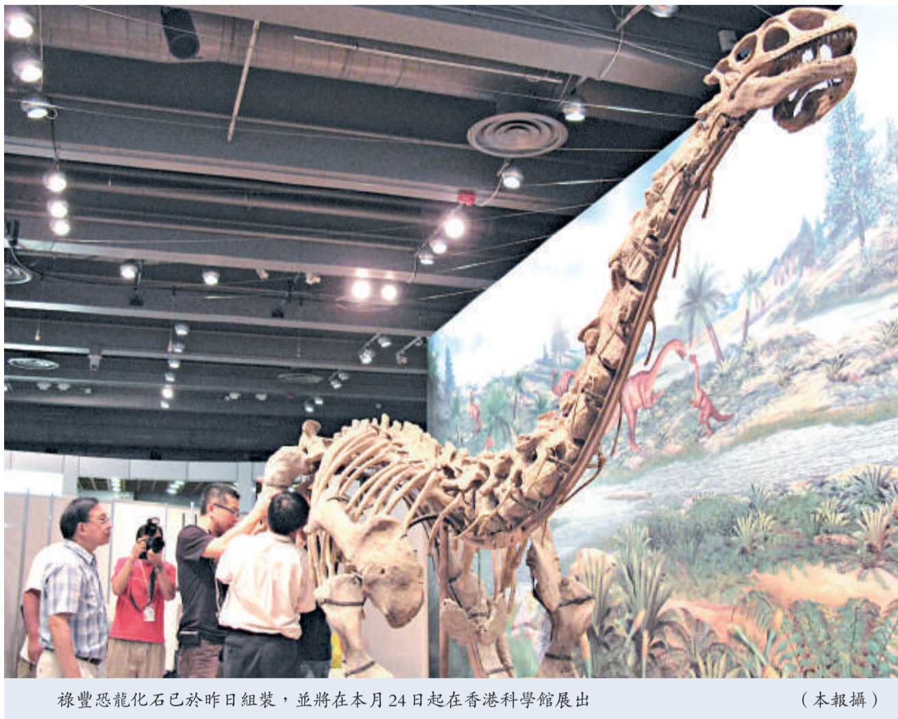
祿豐恐龍化石已於昨日組裝，並將於本月24日起在香港科學館展出

雲南省贈予本港的國寶級文物——一億八千萬年前的巨型「祿豐龍」恐龍化石昨日正式開箱組裝，三百多塊骨骼在專家手中神奇復活，香港科學館重現「侏羅紀」。從本周五起的首半年，恐龍化石將向市民免費展出，之後將在科學館永久展出。