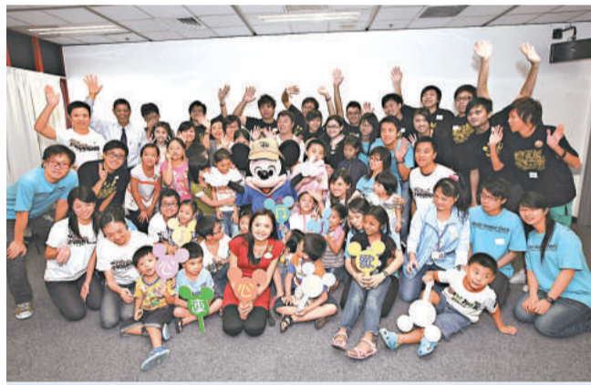
米奇老鼠也來開顧參加「心連童心歌唱計劃」的小朋友

藝人姜大衛及家人亦有出席啓動禮，與市民分享人間的相處之道。他的太太李琳琳表示，多溝通是維持感情的良方。她笑稱，每天至少與丈夫通一、兩個電話，結婚至今已達萬餘次了。然而，更誇張的是她女兒，每天都打幾十個電話給丈夫，她相信女兒有能力維持雙方的感情。另一方面，李琳琳認為中國人生性內斂，如能多做出擁抱或親吻的動作，可使對方感到溫馨，安慰作用更勝於送禮物，有助維持家庭和諧。