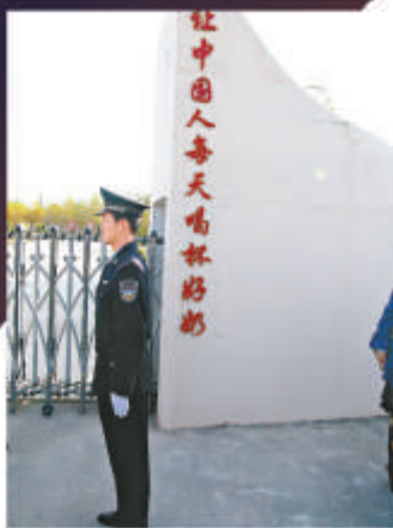
▲奶聯社門口執勤的警察