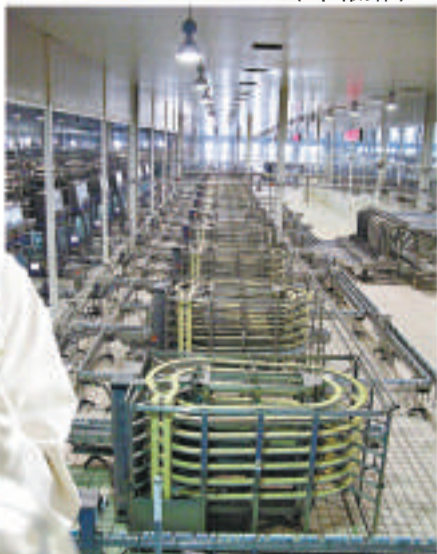
▲蒙牛集團現代化生產車間一角 (本報攝)