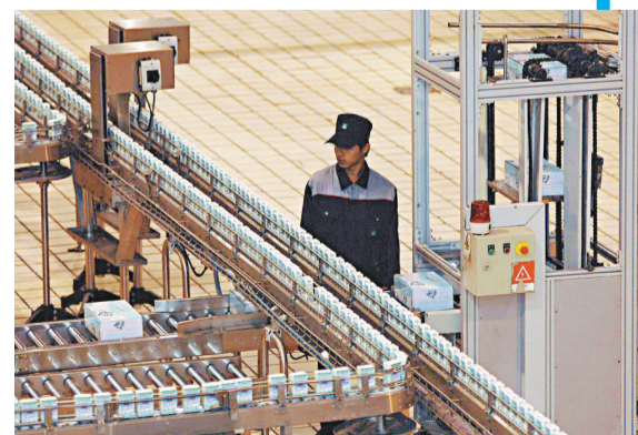
▲蒙牛生產線