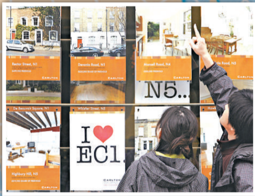
▲英供樓可超過四十年