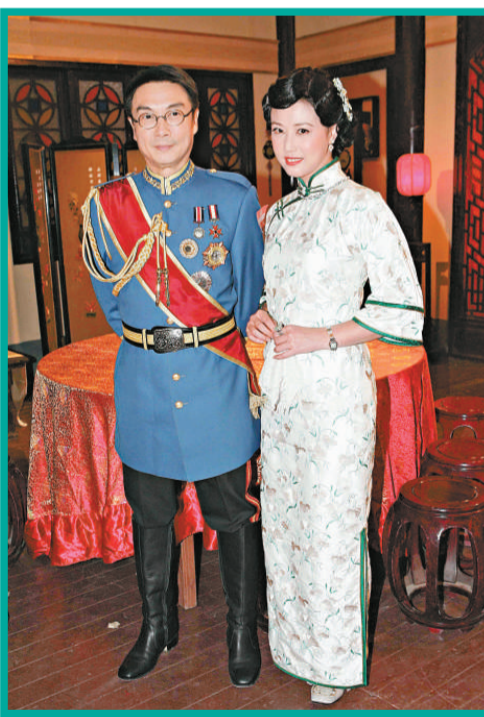
劉松仁與周海媚未知能否給觀眾帶來驚喜