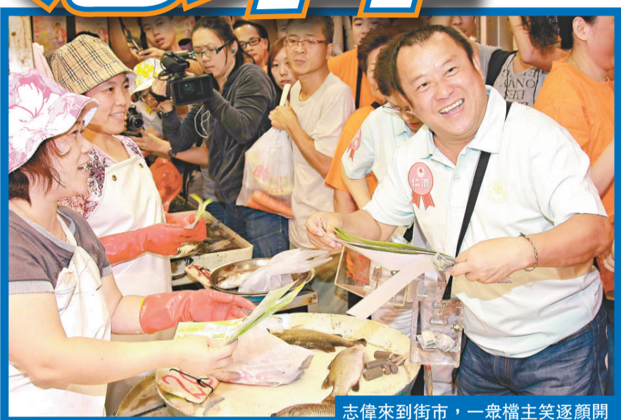
志偉來到街市，一眾檔主笑逐顏開