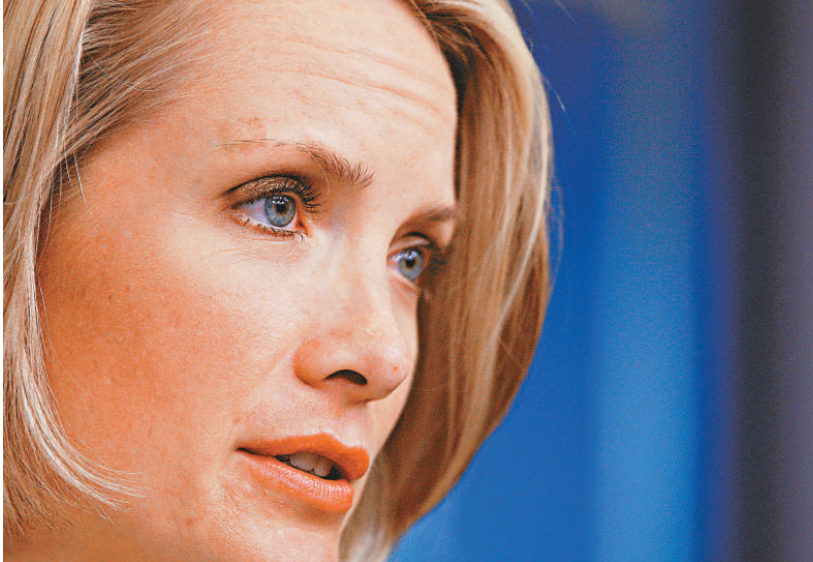
白宮發言人佩里諾說，這次峰會將徵求下任美國總統的意見

除了西方七國集團成員即美國、日本、英國、德國、法國、意大利和加拿大之外，二十國集團還包括歐盟、中國、巴西、印度、俄羅斯、韓國、阿根廷、澳洲、印度尼西亞、墨西哥、沙特阿拉伯、南非和土耳其。二十國集團在一九九九年十二月曾在柏林舉行首次峰會，討論如何應對當時的金融危機。