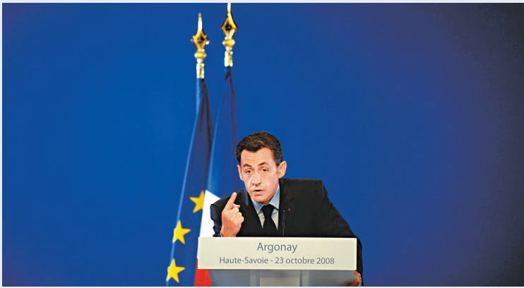
法國總統薩爾科齊宣布，法國政府將成立一個國富基金，以協助國內企業

而據彭博社二十三日報道，法國總統薩爾科齊二十三日在一場會議上宣布，法國政府將成立一個國富基金，以協助國內企業。