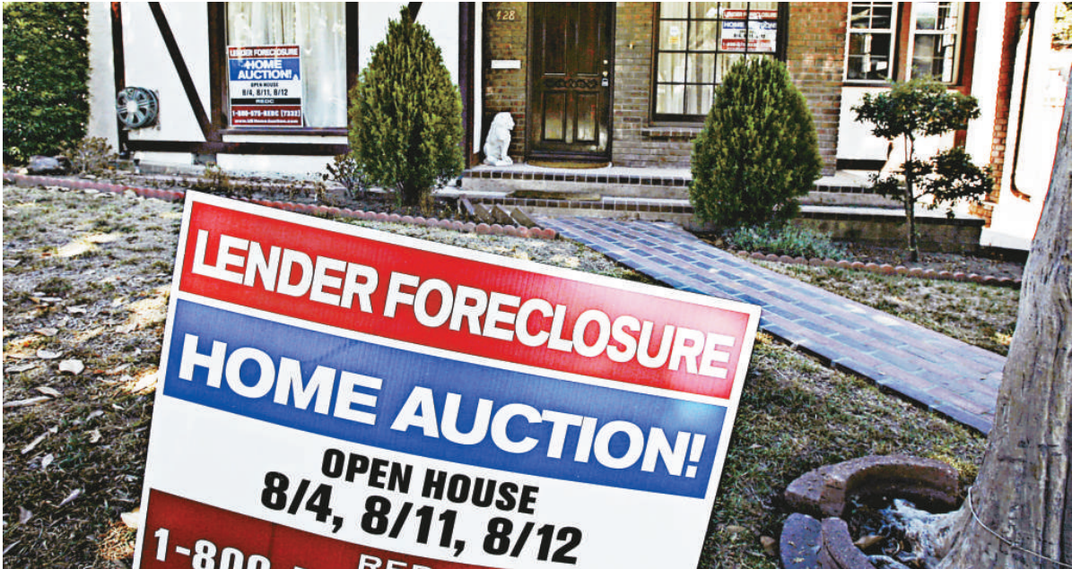
▲▼美國第三季房屋所有權被銀行收回件數較去年同期增加七成，創歷史新高

財政部也受到壓力，要求它採取更進取的行動來幫助業主。基於此，該部現正商討這個「救屋」辦法。另外，財政部也在制訂其他計劃，擬從七千億美元救市資金中撥出一部分來直接購買按揭和重新審核按揭條件。 財政部官員星期四下午分批私下向參議院金融服務委員會成員匯報他們的計劃，旨在協助業主。其他可能的計劃包括利用按揭巨頭房利美和房地美來調低按揭率，並通過聯邦房管局為那些不昂貴、經過再談判的貸款提供保險。根據該救屋計劃的條款，財政部有義務利用其新獲得的權利來幫助瀕臨遭查封拍賣的業主。 評級機構穆迪表示，預計約有七百三十萬名美國業主將在二〇〇八年至二〇一〇年拖欠按揭，其中四百三十萬名業主將失去房屋。上述拖欠率，幾乎是正常經濟時期拖欠率的三倍，並將造成一系列的經濟惡果，包括進一步壓低房價。 本月，聯邦房管局推出了一個三千億美元的方案，被稱為「業主希望」計劃。根據該計劃，那些其房屋價值已低於銀行欠款的業主，其資格獲確認後，如果銀行同意減少未償本金的話，業主將可獲新貸款並由政府提供擔保。該計劃剛啟動數周，尚未有進展方面的統計。 政府還在制訂一個計劃，以便從金融機構買下數十