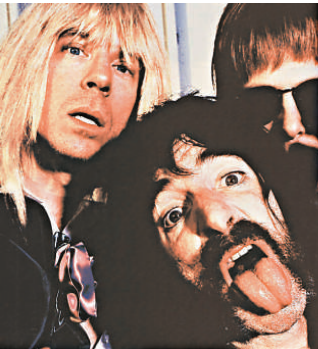
《This is Spinal Tap》票房與口碑俱佳

看過《真的戀愛了》（Love Actually）的觀眾，相信對那位在雪中跟多位性感「聖誕美人」演唱《Christmas is all Around》的Billy Mack，印象深刻，而飾演該老歌手的標禮希（Bill Nighy）在一九九八年也曾任《Still Crazy》中飾演過氣Rock友，在二十世紀七十年代曾經紅極一時，