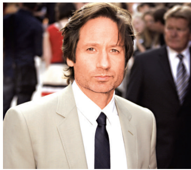
杜楚尼與訟保私隱