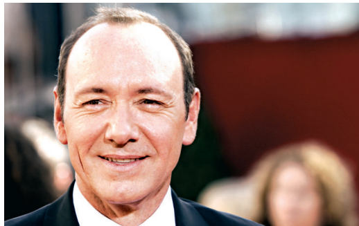
奇雲史柏西演而優則導