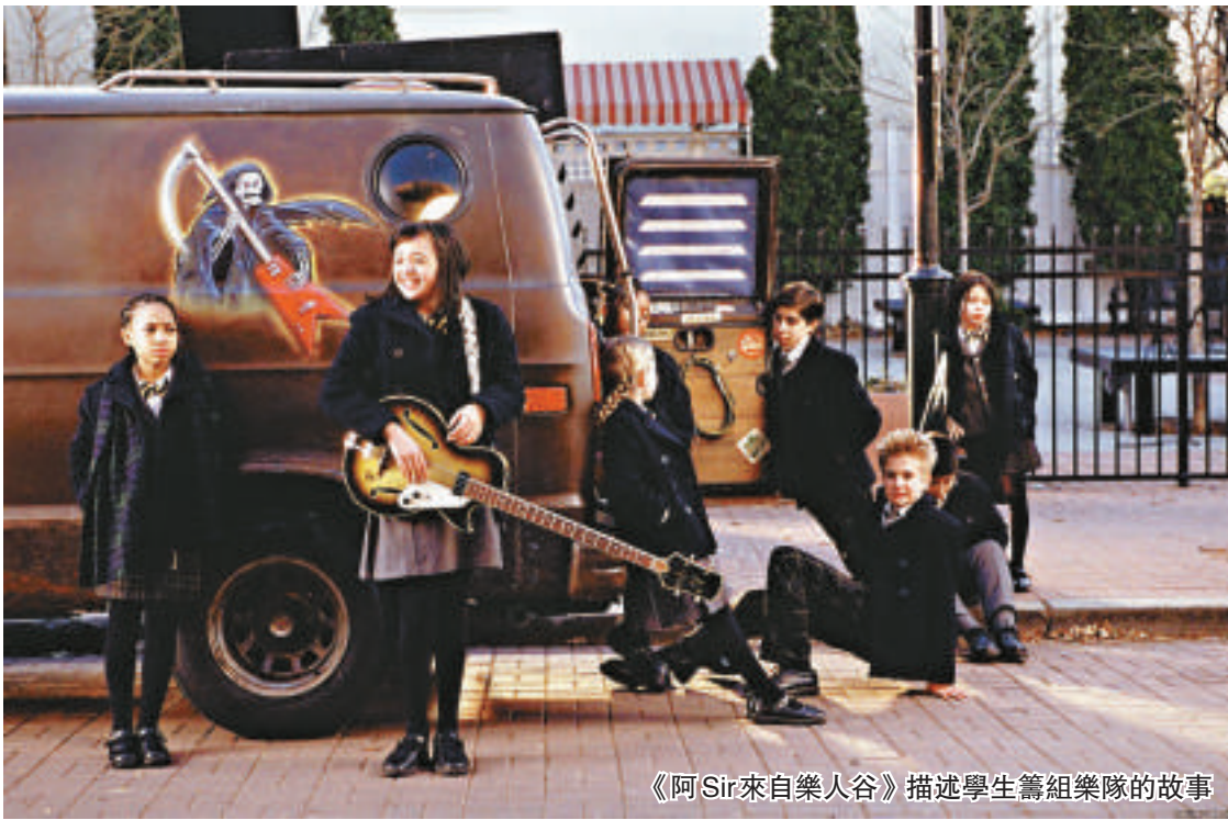
《阿Sir來自樂人谷》描述學生籌組樂隊的故事