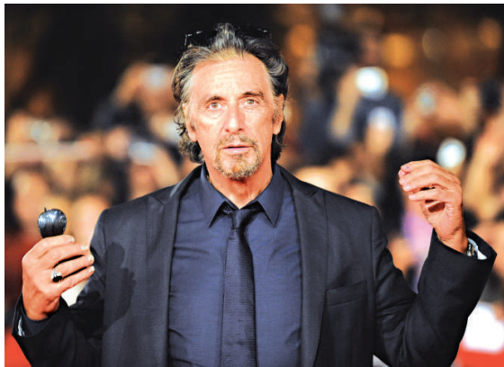
阿爾柏仙奴現身羅馬電影節

拍過約四十齣電影的阿爾柏仙奴為該校的聯合校長，他表示獲獎的感覺難以形容。一九九二年，他憑《女人香》（Scent of a Woman）成為奧斯卡影帝；對於演出，他表示其心得是「綵排」，並說：「運用你的語言，學習怎樣綵排，然後去做。我的模式是釋放感覺，別給自己束縛。」