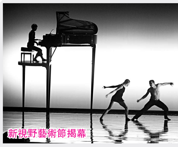
荷蘭舞蹈團昨日首晚演出《原、迷月、虛凝之間》，為「新視野藝術節」揭開序幕，該劇場將演出三場，圖為「虛凝之間」錄排片段