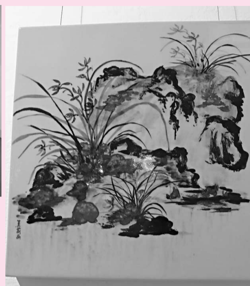
▲瓷畫《蘭草系列》作品之一