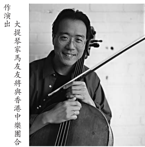
大提琴家馬友友將與香港中樂團合作演出

【本報訊】「馬友友與HKCO」音樂會下月八日（星期六）於香港文化中心音樂廳舉行。這套為新視野藝術節設計的音樂會經過四年精心的籌備，特邀蜚聲國際的大提琴家馬友友與香港中樂團演出。大提琴與大型民族樂隊同台，迸發耀目璀璨的火花，為觀眾帶來前所未有的驚喜。