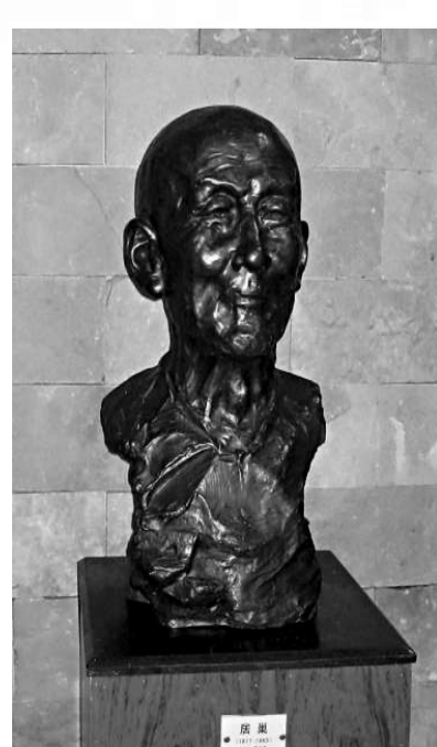
▲曹崇恩塑造的居巢像

十香園位於廣州市海珠區江南大道中懷德大街三號。建於晚清時期一八五六年前後，面積約六百四十平方米，是晚清花鳥畫家居巢、居廉的故居及作畫授徒之所。他們接受以譚南田為主的傳統花鳥畫技法的基礎上，創研「撞粉」、「撞水」新法，同時倡導寫生，追求新意，成為清末嶺南畫壇的主流。 十香園以學館形式，培育了廣東一代畫人，包括了後來的「嶺南畫派」創始人高劍父、陳樹人都是出自其門的出色入門弟子。 十香園種植素馨、瑞香、夜來香、鳳爪、茉莉、夜合、珠蘭、魚子蘭、白蘭，含笑十種香花、故名「十香園」。傳說中另有一解，指居氏兄弟曾在廣西充任幕僚榮歸家鄉，獲贈重金及十位侍妾而得以建園冠名「十香園」。 一九八三年，歷經滄桑的十香園，被定為廣州市文物保護單位。園內有今夕庵、嘯月琴館、紫梨花館等建築，疏木婆娑、香花競艷、幽然天趣、風雅宜人。 今夕庵即是今夕堂，是居巢的畫室、會客室和起居室。當年與他詩畫往來文人墨客有：羽中、陳璞、馮瑞蘭、馮瑞光、伍廷鑑、梁天桂、蘇道芳、張崇光等。如今的今夕庵堂內中央，設居巢和楊永珩一同品畫時的蠟像。楊永珩（一八〇九——一九〇三）字樞樞、廣東番禺瑤溪人，清末廣東文壇重要人物，不僅長於詞詩文賦，在書畫上也卓有成就。著有《添茅小居詩草》六卷。 嘯月琴館是居廉所兼畫室，以他的古琴「嘯月琴」命名。館前奇石異石，間以花草點綴其中，室內畫案，擺滿草蟲標本，以供寫生。 今夕庵對面是紫梨花館，館前原來種紫藤、鳳凰樹等，故得名紫梨花館，匾額為晚清畫家居秋海所題，是居廉課徒傳藝之所。「嶺南畫派」創始人高劍父