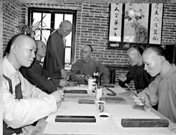
▲紫梨花館內的居廉師徒蠟像