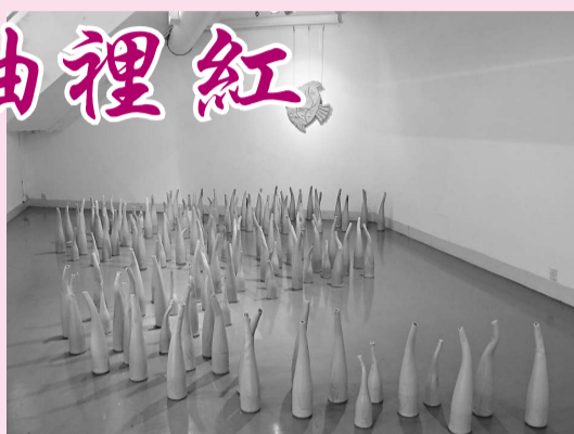
▲以青瓷創作的裝置作品《魚樂無窮》