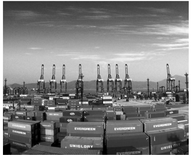
招商國際集裝箱碼頭

如今，大樹島的城市化不斷加快，原有21個行政村已撤村9個，同時成立了海灣等6個社區居委會，初步形成了大樹社區框架。