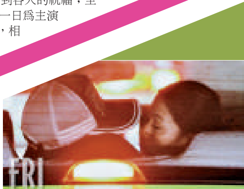
▲田口淳之介（左）與小嶺麗奈於車廂中情不自禁輕吻起來

道赤西仁與西山緋聞的雜誌，邊看邊笑，殊不知自己也成為偷拍目標。購物完畢後，兩人同乘的士離開，更在後座中情不自禁地輕吻起來。