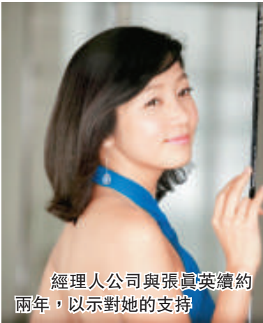
經理人公司與張真英續約兩年，以示對她的支持

被證實患上胃癌的張真英，本月二十三日與經理人公司續約兩年，而經理人公司更表示會全力支持她，祝福她早日戰勝病魔。張真英在上月底入院，現時正接受治療。經理人公司認為張真英是韓國不可多得的女演員，為韓國電影業作出很大貢獻，並表明在她康復後會讓她拍片。