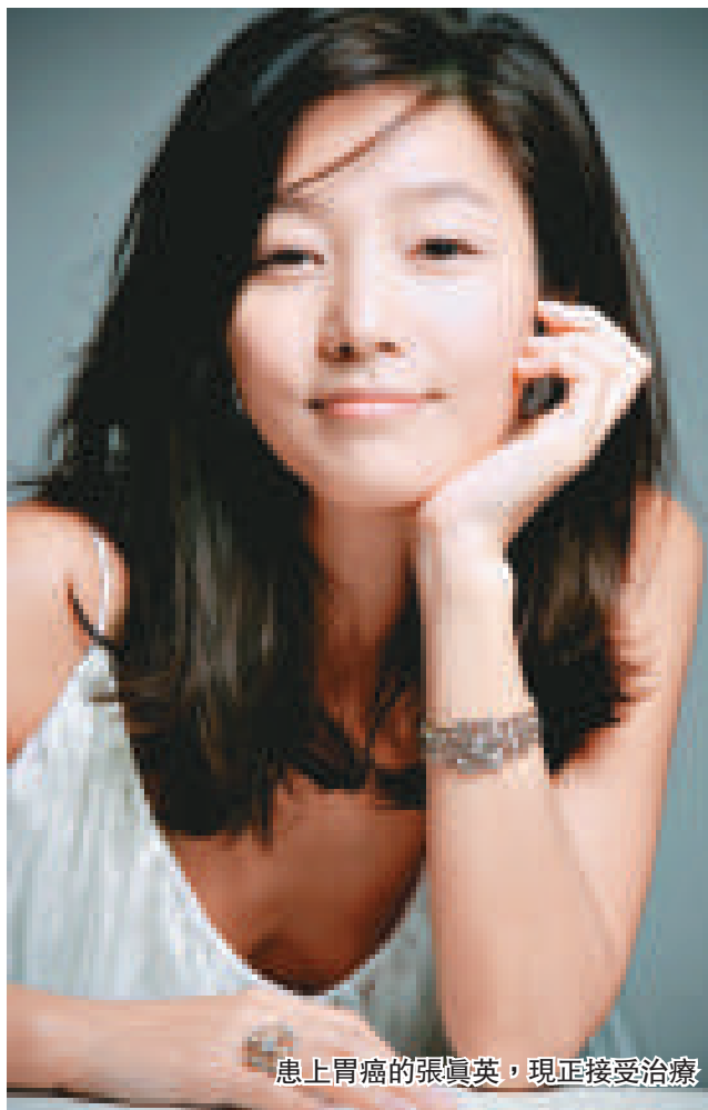
患上胃癌的張真英，現正接受治療

被證實患上胃癌的張真英，本月二十三日與經理人公司續約兩年，而經理人公司更表示會全力支持她，祝福她早日戰勝病魔。張真英在上月底入院，現時正接受治療。經理人公司認為張真英是韓國不可多得的女演員，為韓國電影業作出很大貢獻，並表明在她康復後會讓她拍片。