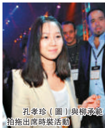
孔孝珍（圖）與柳承範拍拖出席時裝活動

韓國二〇〇九春夏首爾時裝周於本月二十四日在首爾展覽中心舉行，而銀幕情侶柳承範和孔孝珍，以及鄭麗媛、金孝真和李荷娜等出席。柳承範和孔孝珍均表示自己是韓國時裝設計師的粉絲，當中最喜歡李錫泰的設計，柳承範當日更身穿西裝配紅帽，非常搶眼。