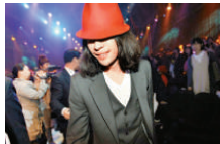
▲戴上紅帽的柳承範出席時裝活動，十分搶鏡

韓國二〇〇九春夏首爾時裝周於本月二十四日在首爾展覽中心舉行，而銀幕情侶柳承範和孔孝珍，以及鄭麗媛、金孝真和李荷娜等出席。柳承範和孔孝珍均表示自己是韓國時裝設計師的粉絲，當中最喜歡李錫泰的設計，柳承範當日更身穿西裝配紅帽，非常搶眼。