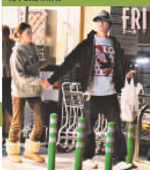
▼田口淳之介（右）與小嶺麗奈手拖手到超市購物