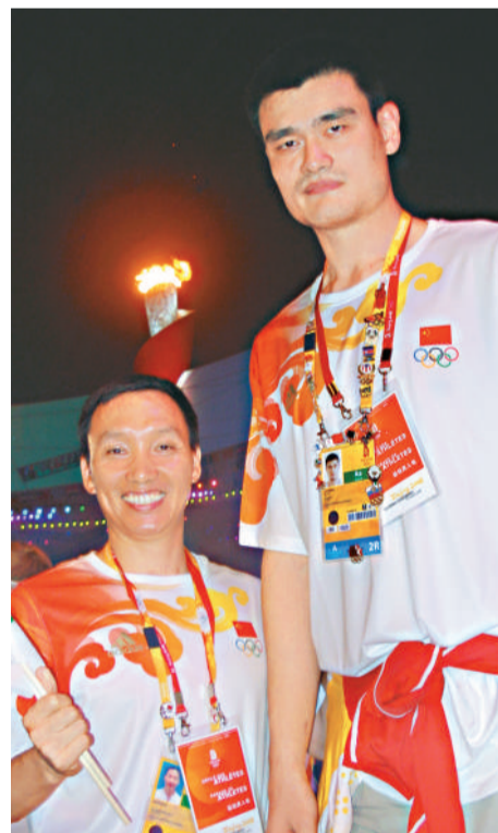
參加京奧，陳方燦有機會與一眾球星合照，姚明便是其一