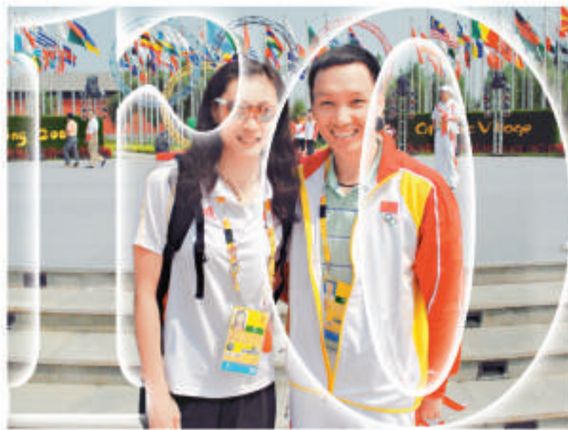
陳方燦和兩屆奧運羽毛球單打冠軍張寧是亦「醫」亦友