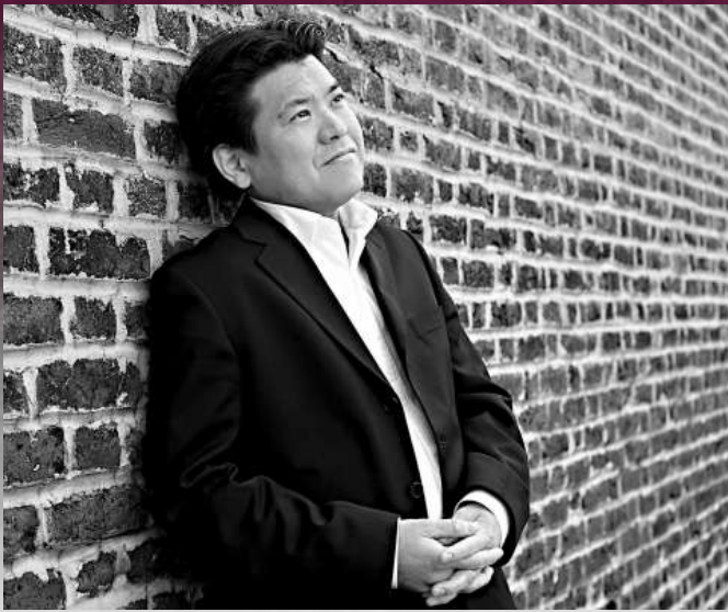
▲日籍年輕指揮家篠崎靖男