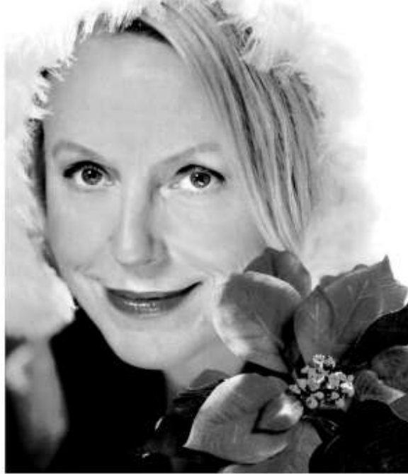
瑞典女中音安妮·蘇菲·馮奧達將為香港歌迷演唱聖誕樂曲

另外，節目設有音樂會前座談會，由本地女高音歌唱家陳少君主講（粵語），十二月六日（星期六）下午三時於香港文化中心行政大樓4樓1號會議室舉行，免費入場，座位有限，先到先得。