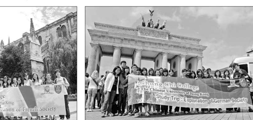
（左圖）參加「法國社會探索之旅」的崇基同學在法國留影；（右圖）在「德國社會探索之旅」中，崇基同學除學習德語之外，還有機會了解當地社會發展狀況

地風土人情的機會。另外，崇基學院舉辦的「德國/法國社會探索之旅」今年已踏入第八年，共有三十八位學生獲選前往德國或法國，進行為期約三星期的文化交流。是項計劃的目的是希望加深學生對德國或法國的文化及社會的認識，研習內容包括基本德語或法語課程、文化交流聚會及參觀歷史名勝。崇基與香港中華基督教青年會合作的「暑期工作實習計劃」，主要為學生提供到英、美等地進行暑期實習的機會，並在當地擔任導師，希望學生藉此認識外國工作環境及文化，並融入當地生活。崇基學院今年與蘭州大學合辦了「甘肅行中國西部文化考察」，共有十六位崇基學生參加，此行令學生了解到甘肅等西北地區人民的宗教、民族、歷史及文化，並感受其藝術氣息和欣賞自然風光。