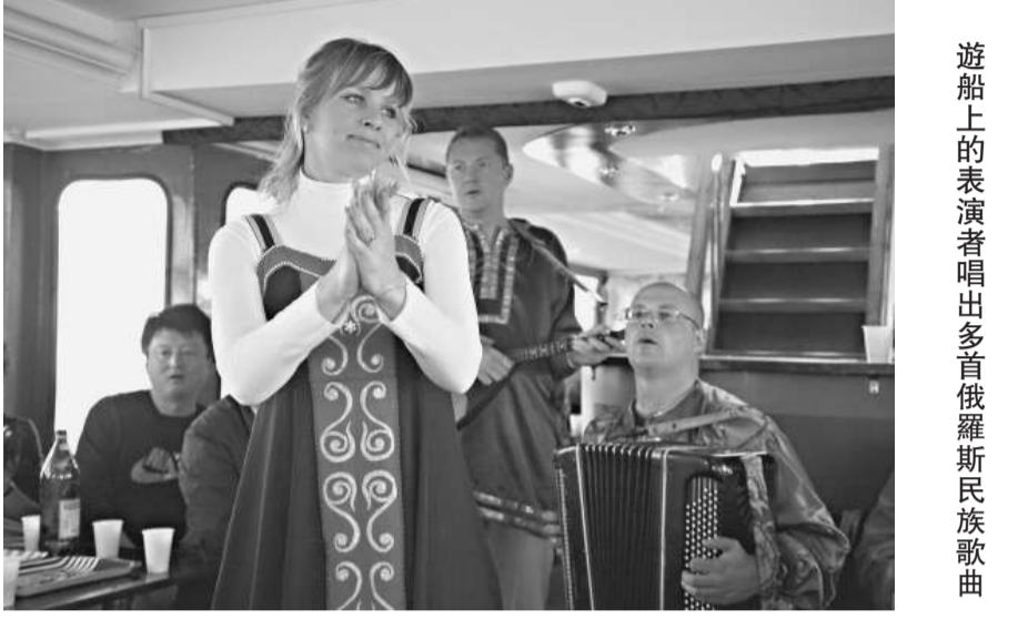
遊船上的表演者唱出多首俄羅斯民族歌曲