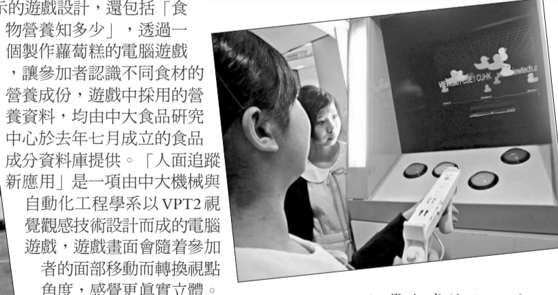
▲VPT2視覺觀感技術設計而成的電腦遊戲

由中大機械與自動化工程學系設計的「海洋生態之旅」3D虛擬遊戲也同樣吸引了大批學生參與。財政司司長曾俊華參觀中大攤位期間也與勁勁地試玩了這項遊戲。這是一項特別為香港科學館設計的3D虛擬遊戲，旨在讓參加者了解環境污染對海洋生態的破壞，以及環境保護的重要性。中文大學在嘉年華活動中展示的遊戲設計，還包括「食物營養知多少」，透過一個製作羅密歐的電腦遊戲，讓參加者認識不同食材的營養成份，遊戲中採用的營養資料，均由中大食品研究中心於去年七月成立的食物成分資料庫提供。「人面追蹤新應用」是一項由中大機械與自動化工程學系以VPT2視覺觀感技術設計而成的電腦遊戲，遊戲畫面會隨著參加者的面部移動而轉換視點角度，感覺更真實立體。