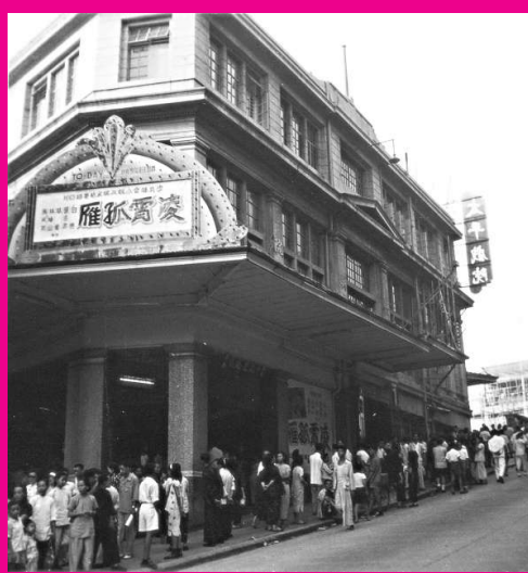
▲1950年太平戲院外門庭若市