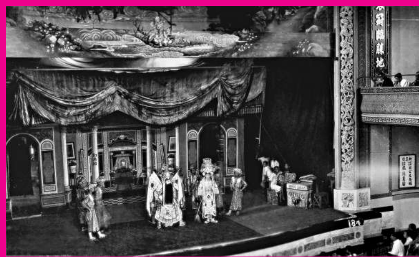
▲粵劇藝人在利舞臺演出劇照(約1928年)