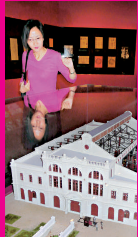
▲建於一九〇四年的太平戲院之建築模型，建築風格中西合璧

昔日的粵劇戲院，建築華麗宏偉，燈火璀璨，鑼鼓「咚咚」，繁華熱鬧。太平、高陞、中央、利舞臺、普慶、東樂……曾幾何時，成為了粵劇迷追星的地方，但隨着上世紀九十年代孤零零的利舞臺那黯淡餘輝熄滅，昔日粵劇大戲院的光輝已不復再。現於香港文化博物館舉行的「戲台上下——香港戲院與粵劇」展覽，透過約二百項照片、圖則、座位表、戲票、模型等，將昔日粵劇戲院的面貌重現眼前，讓人回顧粵劇戲台上所經歷的時代轉變。