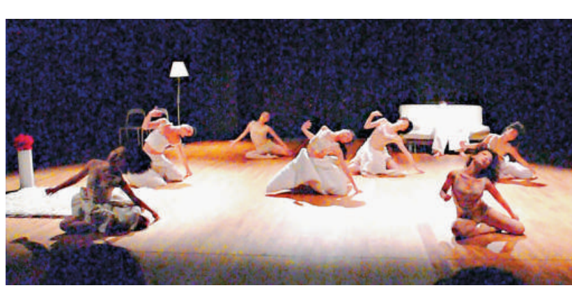
「動藝」率先使用黑盒劇場，為啓動禮演出《不是陌生人》