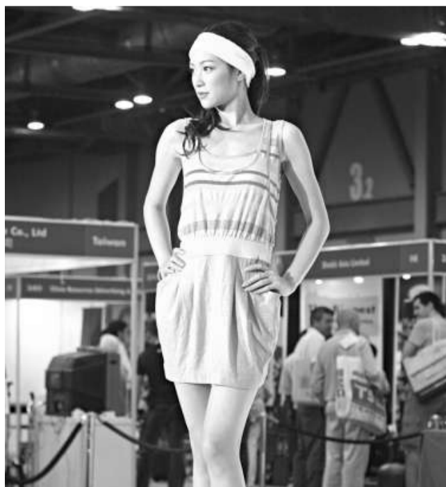
休閒服飾加入運動元素

另外，民政事務局長曾德成昨日書面回覆議員提問時表示，今年首九個月，康文署轄下各個公眾游泳池的入場人次，較去年同期上升了約三成。