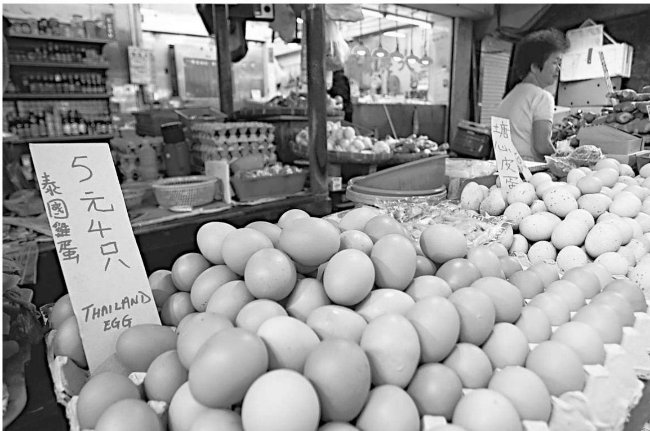
雞蛋檔已轉售其他國家出口的雞蛋，如泰國、德國

陳業表示，公司為多間酒樓提供雞蛋，包括驗出雞蛋有三聚氰胺的牛頭角明星海鮮酒家，自食安中心公布有關結果後，不少客戶要求取消訂單，生意大減，損失近數十萬元，現時該公司只售賣泰國雞蛋，但銷售額減少達一半，擔心經營有困難。