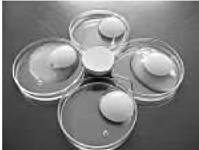
京山鵬昌在其網站表示，所有出口的雞蛋均經過檢疫

潘某還說：接到消息後公司都傻眼了，雞蛋都是從當地農戶手中收購，現在他們弄不清到底是水質出問題，還是飼料出問題。記者隨後從下午二時到五時多次撥打網站所留潘某的聯繫電話，但一直處於無人接聽狀態。