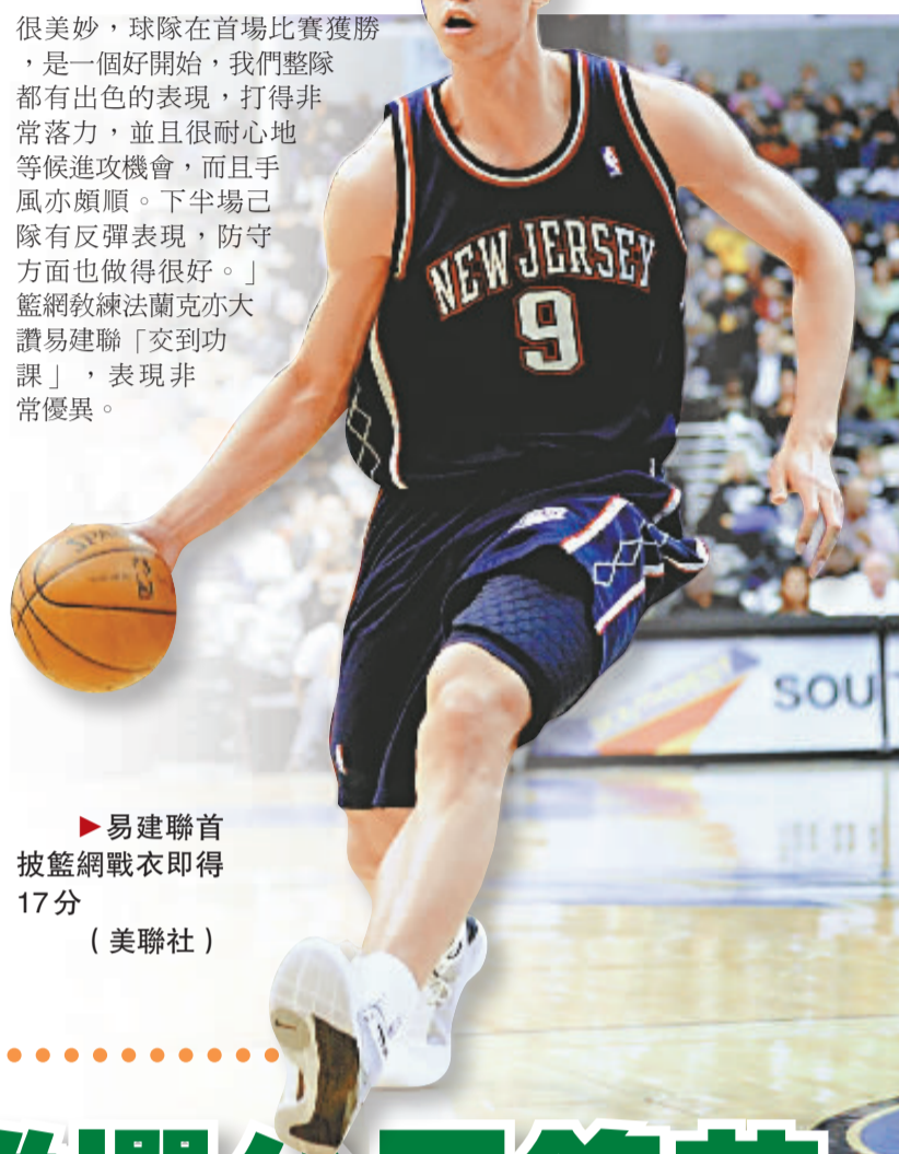
易建聯首披籃網戰衣即得17分