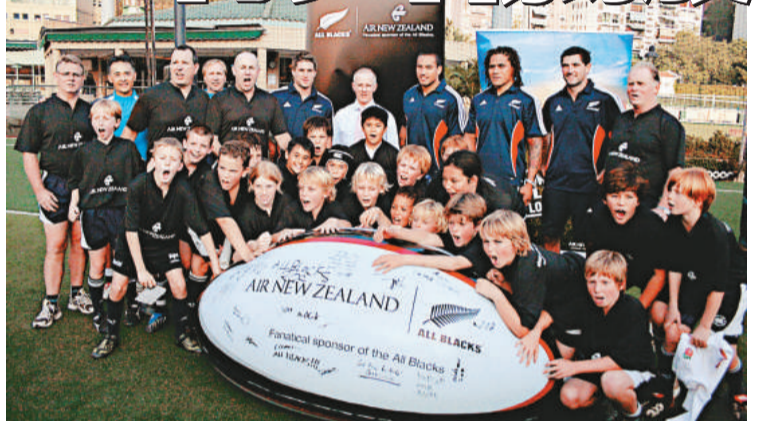
港會少年欖球隊為新西蘭欖球隊送上巨型欖球

【本報訊】即將於周六與澳洲欖球隊進行2008比迪亞杯香港站賽事的新西蘭欖球隊，昨日繼續馬不停蹄出席公開活動，先後於不同場合指導小朋友欖球技巧，致力推廣欖球運動。