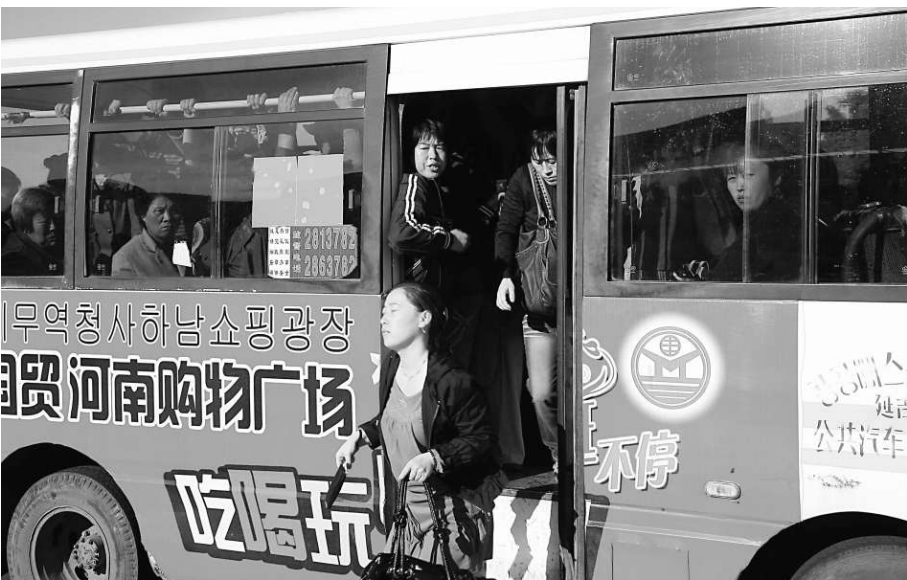
延吉的市面充滿朝鮮文化色彩